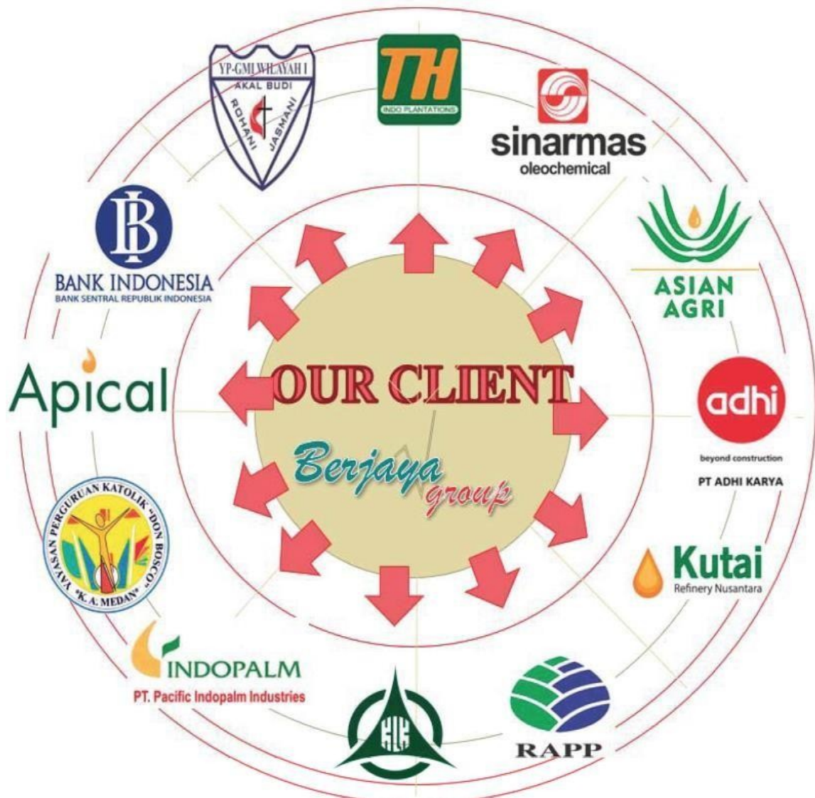
Gambar 1.3 ruang lingkup