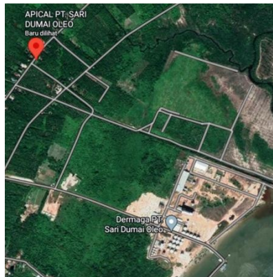
Gambar1. 4 Lokasi Proyek

Proyek konstruksi gedung Oleo Warehouse 2 ini berada di jalan Sibodadi, Lubuk gaung, Kecamatan Sungai Sembilan, Kota Dumai, Riau. Proyek ini berada di kawasan PT.Sari Dumai Oleo Untuk detail Lebih lanjut dapat dilihat di gambar dibawah ini :