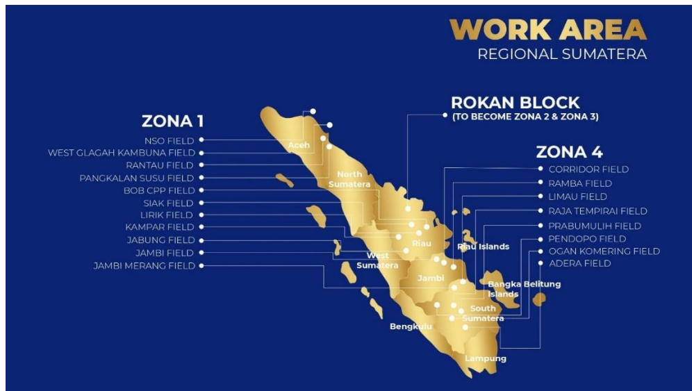
Gambar 1. 1 Work Area Regional Sumatra