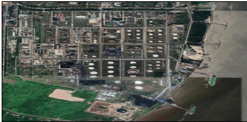
Gambar 1.2 Denah PT. Wilmar Nabati Dumai-Pelintung