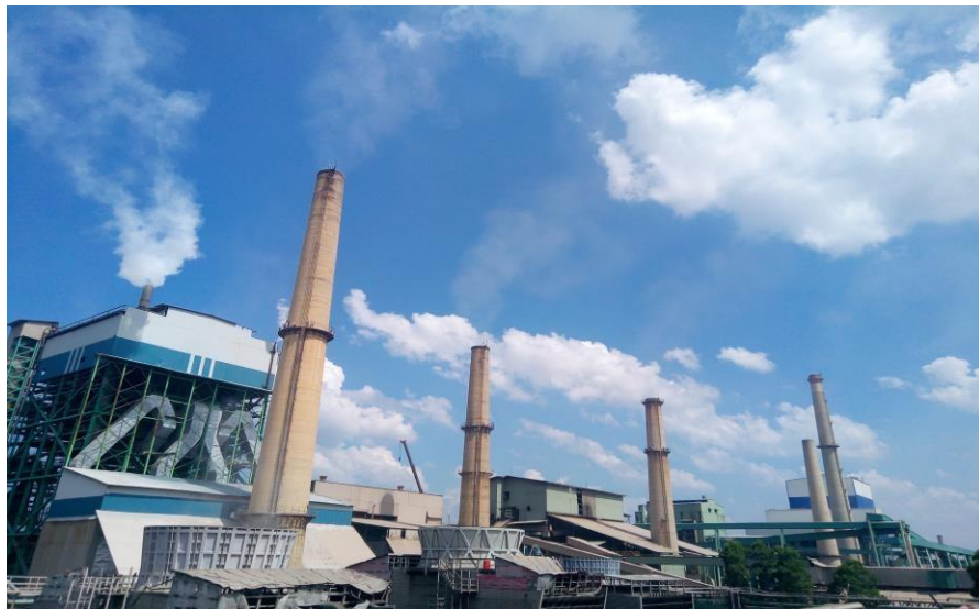
Gambar 1. 2 PT. Indah Kiat Pulp and Paper Perawang

Sementara itu pengoperasian mesin kertas line 3 di pabrik kertas Tangerang dilakukan disamping persiapan lokasi pabrik Pulp di desa Pinang Kabupaten Siak Sri Indrapura, Provinsi Riau.