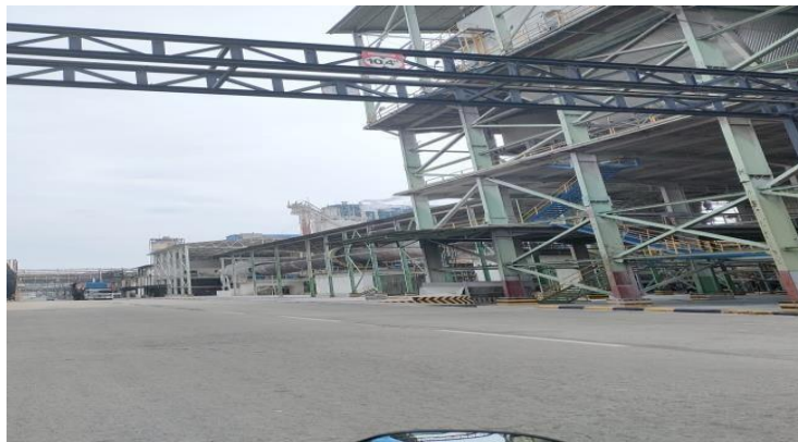
Gambar 1. 3 Penampakan PT. Indah Kiat Pulp and Paper

Produksi percobaan pabrik Pulp dilakukan ditandai dengan peresmian pabrik oleh Presiden Republik Indonesia Bapak Soeharto, pada tanggal 24 Mei 1984. Saat itu kapasitas pabrik pulp sulfat yang di kelantang ( Bleached Kraft Pulp ) adalah 75000 per tahun, sehingga kebutuhan pulp untuk pabrik kertas di Tangerang tidak perlu diimport lagi, melainkan dipenuhi oleh pasokan Pulp dari Provinsi Riau. Pabrik ini merupakan pabrik Pulp Sulfat Kelantang berbahan baku kayu pertama di Indonesia. Pada tahun ini juga dimulai pembangunan Hutan Tanaman Industri (HTI) tahap II.