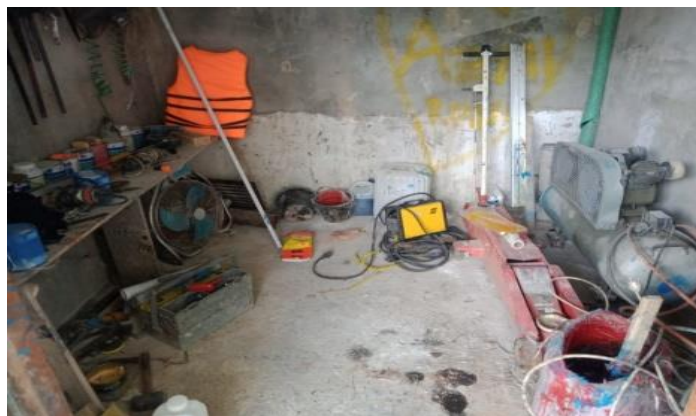
Gambar1 2 Gudang Penyimpanan Alat

Gudang penyimpanan alat ini digunakan sebagai tempat penyimpanan berbagai jenis Alat, Resin dan dongkrak dan berbagai alat yang digunakan dalam pengerjaan kapal. Tujuan dari penempatan gudang penyimpanan alat ini adalah untuk menyimpan alat dalam jumlah banyak untuk keberlangsungan proses pekerjaan diperusahaan. Adapun gudang penyimpanan cat seperti yang ditunjukkan pada Gambar 1.2.