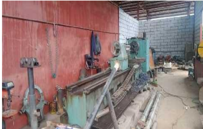
Gambar1 3 Bengkel Baja

Bengkel baja ini dipakai untuk keperluan barang yang akan dibuat seperti, kemudi kapal, Bolard, Dan lain sebagainya. Adapun bengkel baja seperti yang ditunjukkan pada Gambar 1.3.