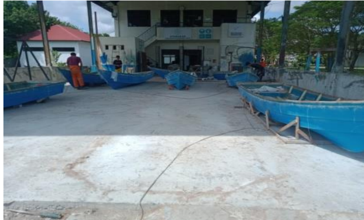
Gambar1 5 Lahan Galangan

Lahan tanah lapang ini digunakan sebagai area penempatan tongkang dan tug boat yang naik dan akan diperbaiki sesuai kerusakan yang terjadi. Adapun lahan galangan seperti yang ditunjukkan pada Gambar 1.5.