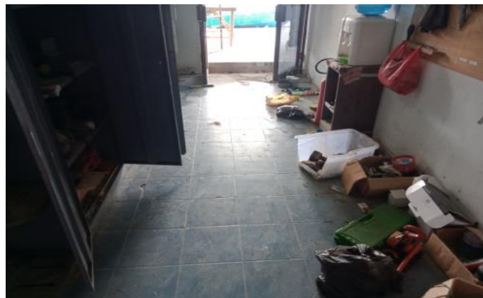
Gambar1 4 Bengkel Non Baja

Bengkel non baja ini digunakan untuk tempat penyimpanan bahan-bahan keperluan pengerjaan kapal seperti, Resin, mat, Wr, dan lain sebagainya. Adapun bengkel non baja seperti yang ditunjukkan pada Gambar 1.4.