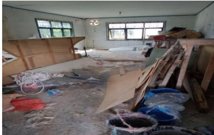
Gambar 1. 1 Gudang Logistik

Fasilitas gudang logistik ini digunakan untuk menyimpan berbagai barang persediaan yang dibutuhkan dalam keberlangsungan pekerjaan yang dilakukan diperusahaan seperti, Mat, Wr , aerosil , talk gerinda dan alat-alat lainnya. Adapun gudang logistik seperti yang ditunjukkan pada Gambar 1.1