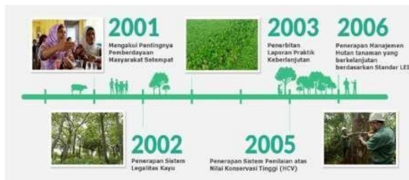
Gambar 1. 2 Perkembangan PT Riau Andalan Pulp and Paper Tahun 2001 - 2005

Pada tahun 2010, kegiatan operasional kehutanan APRIL memberikan kontribusi sebesar 6,9 persen pada total perekonomian Provinsi Riau. APRIL telah menciptakan sekitar 90.000 lapangan kerja bagi masyarakat. APRIL juga berkontribusi terhadap pemberian akses yang lebih baik pada pendidikan dan dukungan sosial di berbagai bidang seperti perawatan kesehatan dan perumahan. APRIL telah membantu meningkatkan standar hidup dan menurunkan tingkat kemiskinan sebesar 30 persen.