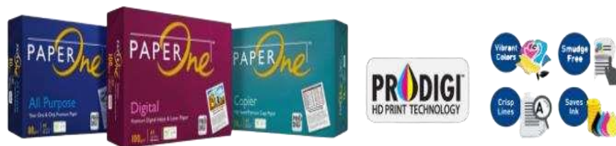
Gambar 1. 5 Produk PT Riau Andalan Pulp and Paper (Sumber: aprilasia.com, 2015)

Adapun wilayah pemasaran produk Riau paper adalah Eropa, Asia, dan pasar dalam negeri. Disamping memproduksi kertas untuk dipasarkan dengan merek dagang sendiri, Riau Paper juga memproduksi kertas untuk merek dagang pelanggan diluar negeri seperti Xerox business, Imperial dan Galaxy .