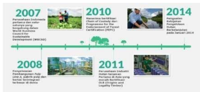
Gambar 1. 3 Perkembangan PT Riau Andalan Pulp and Paper Tahun 2007 – 2011 (Sumber: aprilasia.com, 2015)

Pada tahun 2005, APRIL memperkenalkan sistem penilaian atas Nilai Konservasi Tinggi secara sukarela di daerah konsesinya untuk perencanaan penggunaan lahan. Kebijakan ini memberikan solusi praktis dan bertanggung jawab terhadap tantangan penggundulan hutan dan degradasi. APRIL juga mendirikan APRIL Learning Institute dan memperoleh peringkat yang layak untuk kinerja lingkungan pabrik serta Penghargaan Bendera Emas & Bebas Kecelakaan ( Golden Flag Choice & Zero Accident Award ) untuk manajemen kesehatan dan keselamatan pabrik dari Pemerintah Indonesia.