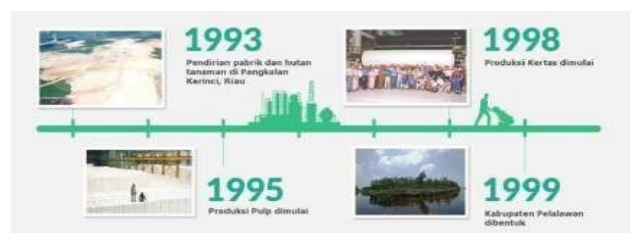
Gambar 1. 1 Perkembangan PT Riau Andalan Pulp and Paper Tahun 1993 – 1999

Sebagai salah satu pelopor perusahaan yang bertanggung jawab, APRIL dan anak perusahaannya melaksanakan prinsip 5C yang dipercaya oleh Bapak Sukanto Tanoto. Praktek bisnis harus membawa kebaikan bagi Masyarakat ( Community ), Negara ( Country ), Iklim ( Climate ), Pelanggan ( Customer ) dan pada akhirnya baik bagi Perusahaan ( Company ). Dengan demikian, tanggung jawab sosial perusahaan diaplikasikan dalam operasional dan manajemen APRIL untuk memajukan lingkungan dan mengembangkan masyarakat serta untuk memenuhi tanggung jawab sosial korporasi. Tanoto Foundation yang didirikan pada tahun 1981 merupakan penerapan visi ini.