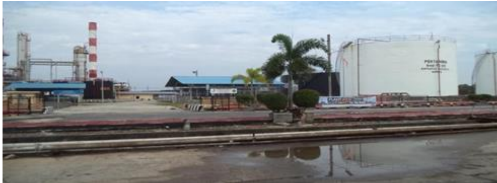
Gambar 1.1 Kilang Minyak PT. Kilang Pertamina Internasional RU II Production Sungai Pakning

Pertamina RU II Dumai terdiri dari dua kilang, yaitu Kilang Putri Tujuh di Dumai dan Kilang Sungai Pakning. Kilang Putri ketujuh Pertamina RU II Dumai sendiri dibangun pada April 1969 berdasarkan kontrak proyek turnkey antara Pertamina dan Far East Sumitomo Jepang.