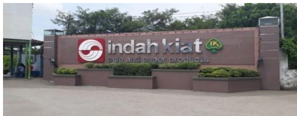
Gambar 1. 2 Logo PT. Indah Kiat Pulp & Paper

Produksi percobaan pabrik Pulp dilakukan ditandai dengan peresmian pabrik oleh Presiden Republik Indonesia Bapak Soeharto, pada tanggal 24 Mei 1984. Saat itu kapasitas pabrik pulp sulfat yang dikelantang ( Bleached Kraft Pulp ) adalah 75000 per tahun, sehingga kebutuhan pulp untuk pabrik kertas di Tangerang tidak perlu diimpor lagi, melainkan dipenuhi oleh pasokan Pulp dari Provinsi Riau. Pabrik ini merupakan pabrik Pulp Sulfat Kelantang berbahan baku kayu pertama di Indonesia. Pada tahun ini juga dimulai pembangunan Hutan Tanaman Industri (HTI) tahap II.