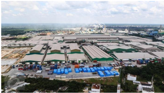
Gambar 1. 1 PT Indah Kiat Pulp & Paper Perawang

Sementara itu pengoperasian mesin kertas line 3 di pabrik kertas Tangerang dilakukan disamping persiapan lokasi pabrik Pulp di desa Pinang Kabupaten Siak Sri Indrapura, Provinsi Riau.