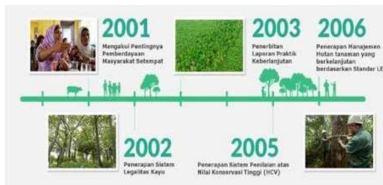
Gambar 1. 2 Perkembangan PT. Riau Andalan Pulp and Paper Tahun 2001-2005 (sumber:aprilasia.com,2015)

Pada tahun 2010, kegiatan operasional kehutanan APRIL memberikan kontribusi sebesar 6,9 persen pada total perekonomian Provinsi Riau. APRIL telah menciptakan sekitar 90.000 lapangan kerja bagi masyarakat. APRIL juga berkontribusi terhadap pemberian akses yang lebih baik pada Pendidikan dan dukungan sosial di berbagai bidang seperti perawatan Kesehatan dan perumahan. APRIL telah membantu meningkatkan standar hidup dan menurunkan tingkat kemiskinan sebesar 30 persen.