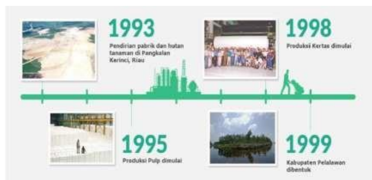
Gambar 1. 1 Perkembangan PT. Riau Andalan Pulp and Paper Tahun 1993-1999

Sebagai salah satu pelopor perusahaan yang bertanggung jawab, APRIL dan anak perusahaannya melaksanakan prinsip 5C yang dipercaya oleh Bapak Sukanto Tanoto. Praktek bisnis harus membawa kebaikan bagi masyarakat ( community ), Negara ( Country ), Iklim ( Climate ), pelanggan ( Customer ) dan pada akhirnya baik bagi perusahaan ( company ). Dengan demikian, tanggung jawab sosial perusahaan di aplikasikan dalam operasional dan manajemen APRIL untuk memajukan lingkungan dan mengembangkan masyarakat serta untuk memenuhi tanggung jawab sosial korporasi. Tanoto Foundation yang didirikan pada tahun 1981 merupakan penerapan visi ini.