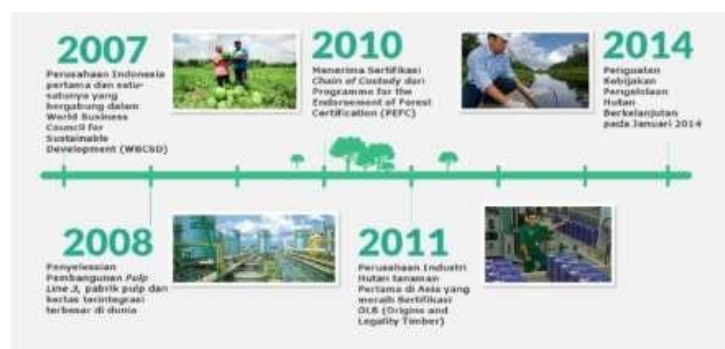
Gambar 1. 3 Perkembangan PT. Riau Andalan Pulp and Paper Tahun 2007-2011 (sumber: aprilasia.com, 2015)

Pada tahun 2003, satu dekade setelah perusahaan didirikan, Grup APRIL menerbitkan Laporan Berkelanjutan perusahaan yang pertama, berisikan inisiatif pengembangan masyarakat beserta komitmennya untuk operasional kehutanan yang berkelanjutan. Pada tahun yang sama, Grup APRIL mendirikan cabang di Guangzhou untuk mendukung perkembangan operasional perusahaan di Tiongkok. Pada tahun 2005, Grup APRIL memperkenalkan sistem penilaian atas Nilai Konversi Tinggi (HCV) secara sukarela di daerah konsesinya untuk perencanaan penggunaan lahan. Kebijakan ini memberikan solusi praktik dan bertanggung jawab terhadap tantangan penggunaan lahan. Kebijakan ini memberikan solusi praktis dan bertanggung jawab terhadap tantangan penggundulan hutan dan degradasi. APRIL juga mendirikan APRIL Learning Institute dan memperoleh peringkat yang layak ( Green Proper Rating ) untuk kinerja lingkungan pabrik serta Penghargaan Bendera Emas & Bebas Kecelakaan ( Golden Flag Choice & Zero Accident Award ) untuk manajemen kesehatan dan keselamatan pabrik dari Pemerintah Indonesia.