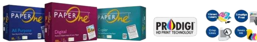
Gambar 1. 5 Produk PT. Riau Andalan Pulp and Paper

PT. Riau Andalan kertas atau yang lebih dikenal dengan Riau Paper merupakan pabrik pembuatan kertas, yang memproduksi kertas photocopy dan uncoated wood free bergramatur 50 gsm sampai 120 gsm dengan menggunakan dua unit mesin kertas beteknologi terkini dan berkecepatan tinggi. Kertas yang dihasilkan oleh Riau paper dipasarkan dalam bentuk Cut Size , Folio Sheeter maupun gulungan ( Roll ), dengan merek dagang yang telah dikeluarkan seperti Paper One , Copy Paper dan Dunia Mas.