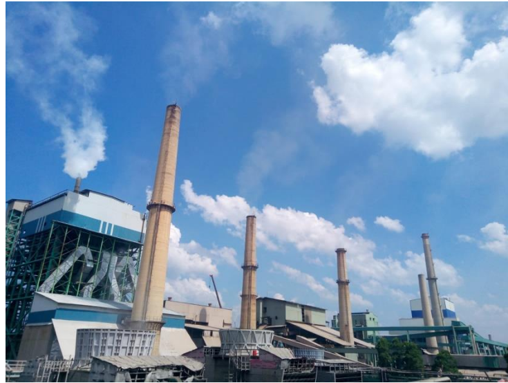
Gambar 1. 2 PT Indah Kiat Pulp & Paper Perawang