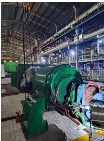
Gambar 1. 3 Penampakan PT. Indah Kiat Pulp & Paper