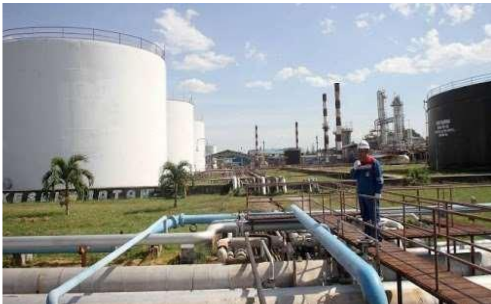
Gambar 1.1 Kilang Produksi PT. KPI Sei. Pakning

Pada awal operasi kilang, kapasitas pengolahannya, baru mencapai 25.000 barel perhari. Pada bulan September 1975, seluruh operasi kilang beralih dari Reficen kepada pihak Pertamina. Semenjak itu kilang mulai menjalani penyempurnaan secara bertahap sehingga, produk dan kapasitasnya dapat ditingkatkan lagi. Menjelang akhir tahun 1977, kapasitas kilang meningkat menjadi 35.000 barel perhari. Mencapai 40.000 barel padatahun April 1980. Dan sejak tahun 1982, kapasitas kilang menjadi 50.000 barel perhari, sesuai kapasitas terpasang.