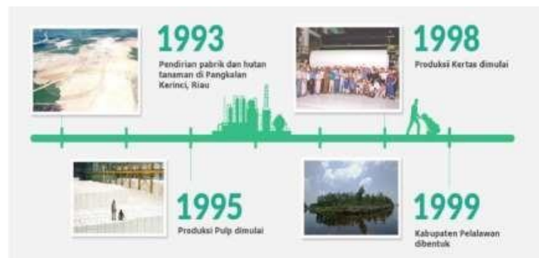
Gambar 1.1 Perkembangan PT. Riau Andalan Pulp and Paper Tahun 1993 – 1999

Sebagai salah satu pelopor perusahaan yang bertanggung jawab, APRIL dan anak perusahaannya melaksanakan prinsip 5C yang dipercaya oleh Bapak Sukanto Tanoto. Praktek bisnis harus membawa kebaikan bagi Masyarakat ( Community ), Negara ( Country ), Iklim ( Climate ), Pelanggan ( Customer ) dan pada akhirnya baik bagi Perusahaan ( Company ). Dengan demikian, tanggung jawab sosial perusahaan diaplikasikan dalam operasional dan manajemen APRIL untuk memajukan lingkungan dan mengembangkan masyarakat serta untuk memenuhi tanggung jawab sosial korporasi. Tanoto Foundation yang didirikan pada tahun 1981 merupakan penerapan visi ini.