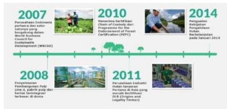
Gambar 1.3 Perkembangan PT. Riau Andalan Pulp and Paper Tahun 2007 – 2011

Pada tahun 2005, APRIL memperkenalkan sistem penilaian atas Nilai Konservasi Tinggi secara sukarela di daerah konsesinya untuk perencanaan penggunaan lahan. Kebijakan ini memberikan solusi praktis dan bertanggung jawab terhadap tantangan penggundulan hutan dan degradasi. APRIL juga mendirikan APRIL Learning Institute dan memperoleh peringkat yang layak untuk kinerja lingkungan pabrik serta Penghargaan Bendera Emas & Bebas Kecelakaan ( Golden Flag Choice & Zero Accident Award ) untuk manajemen kesehatan dan keselamatan pabrik dari Pemerintah Indonesia.