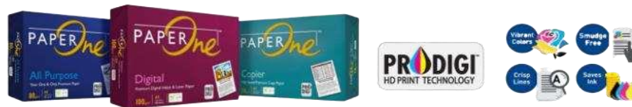
Gambar 1.5 Produk PT.Riau Andalan Pulp and Paper