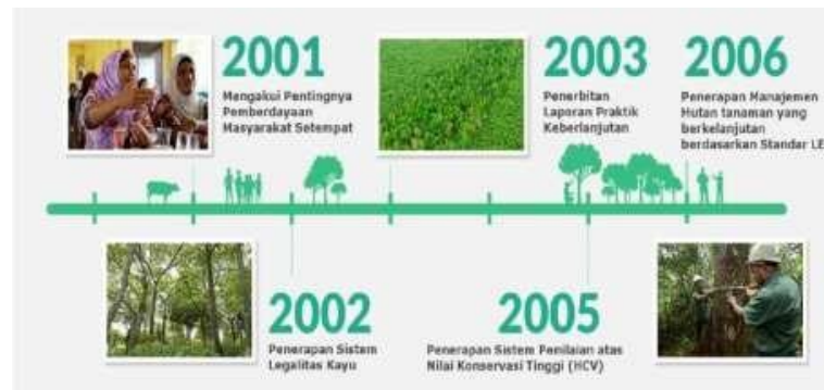
Gambar 1.2 Perkembangan PT. Riau Andalan Pulp and Paper Tahun 2001 - 2005

Pada tahun 2010, kegiatan operasional kehutanan APRIL memberikan kontribusi sebesar 6,9 persen pada total perekonomian Provinsi Riau. APRIL telah menciptakan sekitar 90.000 lapangan kerja bagi masyarakat. APRIL juga berkontribusi terhadap pemberian akses yang lebih baik pada pendidikan dan dukungan sosial di berbagai bidang seperti perawatan kesehatan dan perumahan. APRIL telah membantu meningkatkan standar hidup dan menurunkan tingkat kemiskinan sebesar 30 persen.