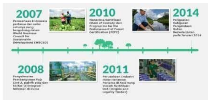
Gambar 1.3 Perkembangan PT. Riau Andalan Pulp and Paper Tahun 2007 – 2011

Pada tahun 2005, APRIL memperkenalkan sistem penilaian atas Nilai Konservasi Tinggi secara sukarela di daerah konsesinya untuk perencanaan penggunaan lahan. Kebijakan ini memberikan solusi praktis dan bertanggung jawab terhadap tantangan penggundulan hutan dan degradasi. APRIL juga mendirikan APRIL Learning Institute dan memperoleh peringkat yang layak untuk kinerja lingkungan pabrik serta Penghargaan Bendera Emas & Bebas Kecelakaan ( Golden Flag Choice & Zero Accident Award ) untuk manajemen kesehatan dan keselamatan pabrik dari Pemerintah Indonesia.