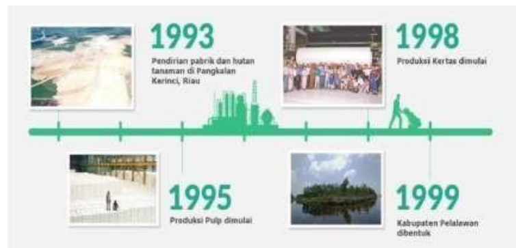
Gambar 1.1 Perkembangan PT. Riau Andalan Pulp and Paper Tahun 1993 – 1999

Sebagai salah satu pelopor perusahaan yang bertanggung jawab, APRIL dan anak perusahaannya melaksanakan prinsip 5C yang dipercaya oleh Bapak Sukanto Tanoto. Praktek bisnis harus membawa kebaikan bagi Masyarakat ( Community ), Negara ( Country ), Iklim ( Climate ), Pelanggan ( Customer ) dan pada akhirnya baik bagi Perusahaan ( Company ). Dengan demikian, tanggung jawab sosial perusahaan diaplikasikan dalam operasional dan manajemen APRIL untuk memajukan lingkungan dan mengembangkan masyarakat serta untuk memenuhi tanggung jawab sosial korporasi. Tanoto Foundation yang didirikan pada tahun 1981 merupakan penerapan visi ini.