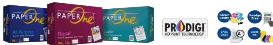
Gambar 1.5 Produk PT. Riau Andalan Pulp and Paper

PT. Riau Andalan kertas atau yang lebih dikenal dengan Riau Paper merupakan pabrik pembuatan kertas, yang memproduksi kertas photocopy dan uncoated wood free bergramatur 50 gsm sampai 120 gsm dengan menggunakan dua unit mesin kertas berteknologi terkini dan berkecepatan tinggi. Kertas yang dihasilkan oleh Riau paper dipasarkan dalam bentuk Cut Size , Folio Sheeter maupun gulungan ( Roll ), dengan merek dagang yang telah dikeluarkan seperti Paper One , Copy Paper dan Dunia Mas .