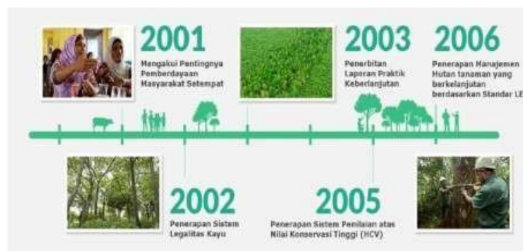
Gambar 1.2 Perkembangan PT. Riau Andalan Pulp and Paper Tahun 2001 - 2005

Pada tahun 2010, kegiatan operasional kehutanan APRIL memberikan kontribusi sebesar 6,9 persen pada total perekonomian Provinsi Riau. APRIL telah menciptakan sekitar 90.000 lapangan kerja bagi masyarakat. APRIL juga berkontribusi terhadap pemberian akses yang lebih baik pada pendidikan dan dukungan sosial di berbagai bidang seperti perawatan kesehatan dan perumahan. APRIL telah membantu meningkatkan standar hidup dan menurunkan tingkat kemiskinan sebesar 30 persen.