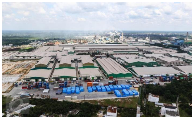
Gambar 1. 1 PT Indah Kiat Pulp & Paper Perawang

Sementara itu pengoperasian mesin kertas line 3 di pabrik kertas Tangerang dilakukan disamping persiapan lokasi pabrik Pulp di desa Pinang Kabupaten Siak Sri Indrapura, Provinsi Riau.