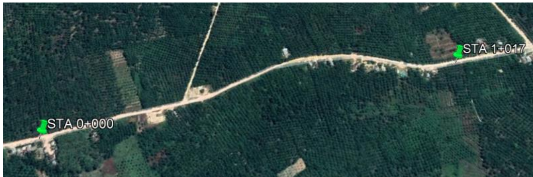
Gambar 1.1 Lokasi Proyek

Lokasi proyek yang sedang di kerjakan ini berada pada Jalan Gajah Han di Desa Muara Basung.