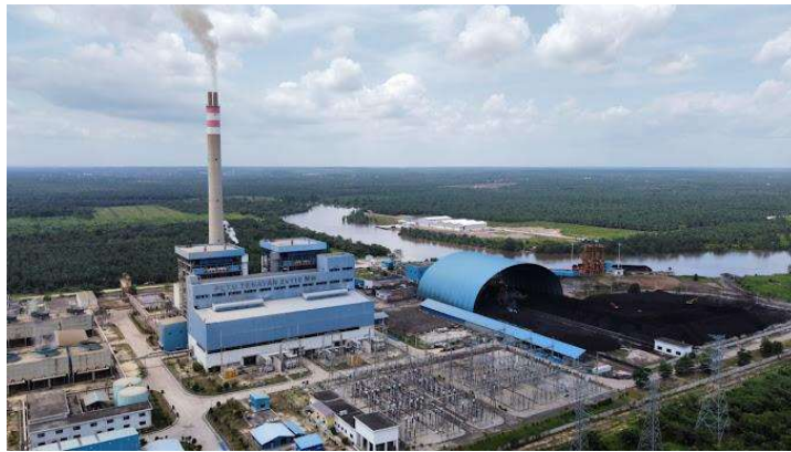
Gambar 1.1 Penampakan PT PLN NP UP Tenayan

PT. PLN Nusantara Power Unit Pembangkitan Tenayan merupakan Pembangkit Listrik Tenaga Uap (PLTU) yang dioperasikan oleh PT PJB Servis. Perkembangan proyek percepatan pembangkit tenaga listrik berbahan bakar batubara berdasarkan pada Peraturan Presiden RI (PerPres) Nomor 112 Tahun 2022 penugasan kepada PT. PLN (Persero) untuk melakukan pembangunan proyek 35.000 MW yang tersebar diseluruh Indonesia dimana salah satunya berlokasi di Pekanbaru. PLTU Riau (2x110 MW) Tenayan resmi beroperasi sejak 1 Januari 2017, serta akan menambah daya untuk jaringan transmisi di Riau yang saat ini tingkat elektrisasinya baru 75,51%. Penampakan PT. PLN NP UP Tenayan dapat dilihat pada gambar 1.1.