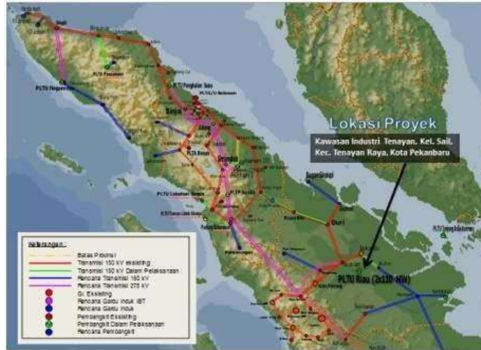
Gambar 1.8 Lokasi PT PLN NP UP Tenayan

Lokasi Proyek : Kify Kat Sall Kec. Senay Rays Kota PrasWERING, lokasi PT. PLN NP UP Tenayan dapat dilihat pada gambar 1.8.