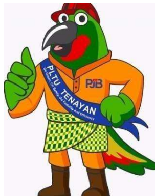
Gambar 1.6 Mascot PT PLN NP UP Tenayan

“Si GARES” ( Go Green, Go safety, Go Reability, Efficiency ), mascot PT. PLN NP UP Tenayan dapat dilihat seperti gambar 1.6