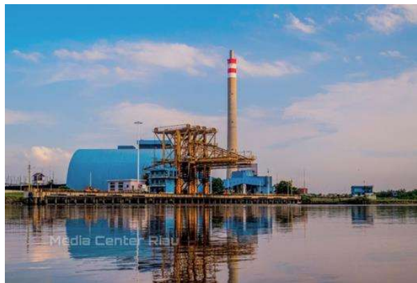
Gambar 1.4 PT PLN NP UP Tenayan Dari Belakang

Dibangun di atas lahan seluas 40 hektar, PLTU Tenayan ini berada persis di tepi Sungai Siak untuk memudahkan pengangkutan suplai batu bara yang kebutuhannya sebesar 1 juta ton per tahun, atau setara dengan 1.824 ton perhari. Meski masih masuk Kota Pekanbaru, PLTU tersebut berada ditengah-tengah kebun sawit warga. Tak jauh dari lokasi pembangkit, terdapat kawasan pusat pemerintahan yang ditandai dengan keberadaan Kantor Wali Kota Pekanbaru yang tengah dibangun. PT. PLN NP UP dari belakang Dapat dilihat pada gambar 1.4.