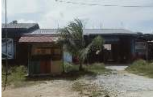
Gambar 1.1 PT.Megapower Makmur Tbk.