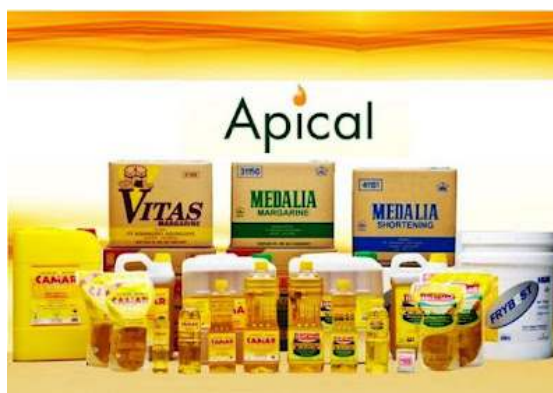
Gambar 1.1 Produk Utama Apical Group

Adapun produk utama dari Apical Group dapat di lihat pada gambar dibawah ini: