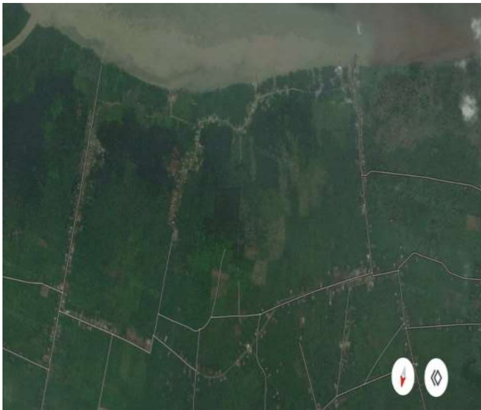
Gambar 1.1 Lokasi Proyek

Proyek peningkatan Jalan Kecamatan Perangsang Barat di Jalan Peranggas sampai Pelabuhan Pecah Buyung.