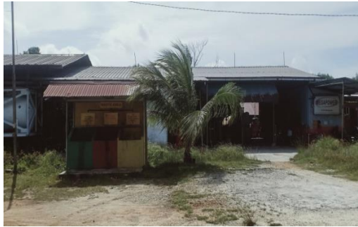
Gambar 1.1 PT. Megapower Makmur Tbk.