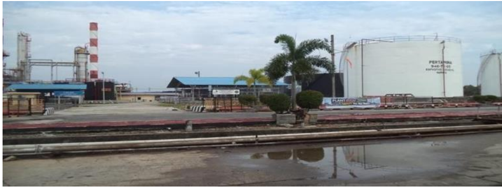
Gambar 1. 1 Kilang Minyak PT. Kilang Pertamina Internasional RU II Production Sungai Pakning

Pertamina RU II Dumai terdiri dari dua kilang, yaitu Kilang Putri Tujuh di Dumai dan Kilang Sei Pakning. Kilang Putri ketujuh Pertamina RU II Dumai sendiri dibangun pada April 1969 berdasarkan kontrak proyek turnkey antara Pertamina dan Far East Sumitomo Jepang. Pembangunan kilang RU II Dumai dikukuhkan dengan Surat Keputusan Dirjen PERTAMINA No.33345/Kpts/DM/1967. Konstruksi dikerjakan oleh kontraktor asing, Ishikawajima Harima Heavy Industries (IHHI). Kontraktor melakukan pekerjaan finishing kilang dan utilitas Crude Oil Distillation Unit (CDU) , TAISEI melakukan pekerjaan sipil yaitu, fasilitas penunjang operasional lainnya seperti tangki produksi, dermaga, pelabuhan khusus dan jaringan pipa. Refinery Unit II merupakan kilang Pertamina terbesar di pulau Sumatera dan memasok 23% kebutuhan minyak nasional. Saat ini wilayah kerja Unit Pengolahan II Dumai meliputi: