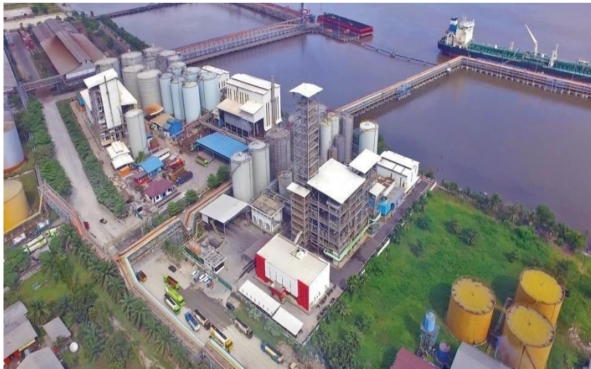
Gambar 1. 1PT. KLK Dumai

PT.kuala Lumpur Kepong Berhad adalah perusahaan multinasional asal Malaysia yang inti kegiatannya adalah pengolahan hasil pertanian (kelapa sawit dan karet). PT.KLK pertama kali membuka cabang di Indonesia tepatnya di Kota Dumai pada 20 Juni 2011 dengan nama PT.KLK Dumai. PT. KLK Dumai merupakan sebuah perusahaan multinasional Malaysia yang terdaftar dipasar utama bursa Malaysia Securities Berhad dan memiliki kapitalisasi pasar sekitar RM.18 milyar per 30 september 2010. KLK juga memperkerjakan lebih dari 3.000 karyawan di seluruh dunia. klk agriservindo (KLKA) adalah anak perusaan dari group KLK sebuah perusahaan yang terlibat dalam perkebunan, oleokimia, pengembangan property dan ritel. Sementara perkebunan tetap menjadi bisnis inti KLK, group KLK telah diperluas ke hilir dengan berbasis sumber daya manufaktur . Group yang di naungi oleh KLK Agriservindo adalah perusahaan perkebunan kelapa sawit dan pengolahannya yang terbesar di 5 provinsi di indonesia, yaitu Sumatra Utara, Riau, Bangka Belitung, Kalimantan Timur dan Kalimantan Tengah dimana PT. KLK dumai merupakan salah satu nya.