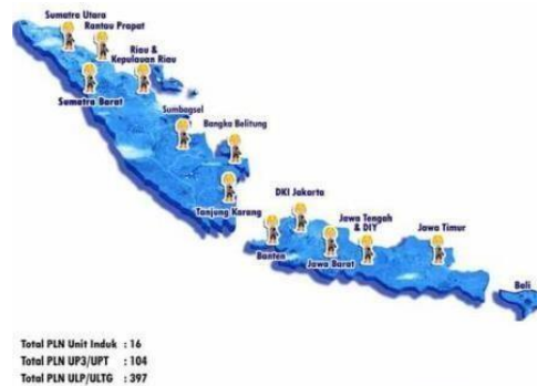
Gambar 1.1 Ruang Lingkup Perusahaan