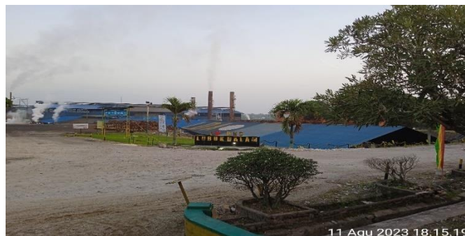
Gambar 1. 1 PTPN V PKS Lubuk Dalam

Agar seluruh karyawan memahami visi dan misi perusahaan, manajemen puncak senantiasa mengkomunikasikan dengan sarana yang tepat untuk memastikan efektivitas pencapaiannya.