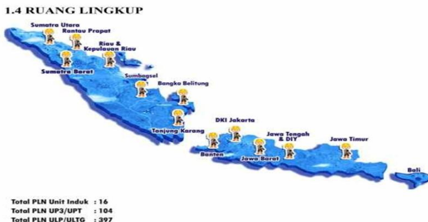
Gambar 1.1 Ruang Lingkup Perusahaan

Dengan demikian agar fungsi, kedudukan maupun antara orang-orang yang menjalankan semua aktifitas dalam organisasi yang lebih jelas, maka suatu organisasi harus mempunyai struktur organisasi. Sedangkan struktur organisasi itu sendiri adalah “Suatu kerangka yang mewujudkan pula tetap dari hubungan yang diantara bidang tertentu”.