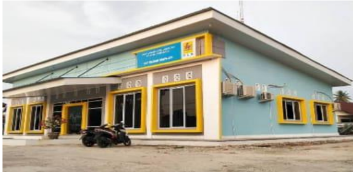
Gambel 1. 1 Kantor PT.PLN (Persero) ULP Bagan Siapi Api

PT.PLN (Persero) ULP Bagan Siapi Api Kabupaten Rokan Hilir Provinsi Riau merupakan salah satu penyedia atau pembangkit listrik tenaga air (PLTA).