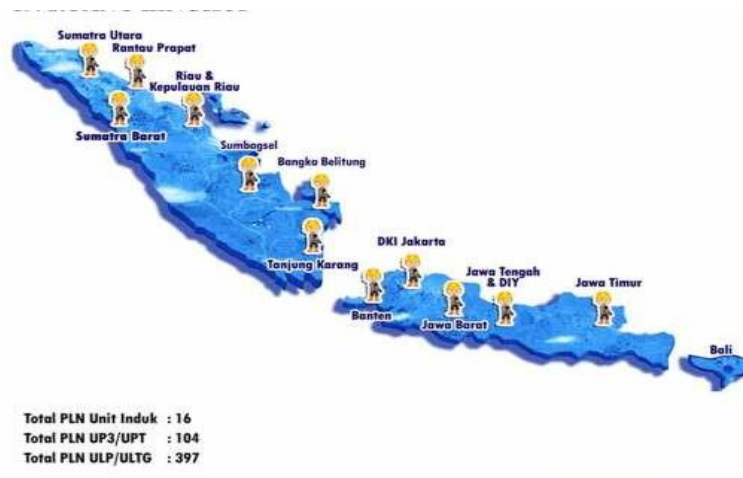
Gambar 1.2 Ruang lingkup PT. Haleyora Power