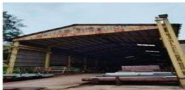
Gambar 1.17 Workshop Piping

Dengan panjang (L) 104 m x lebar (W) 25 m total area 2600 m 2 juga memiliki fasilitas seperti yang dijelaskan dibawah ini: