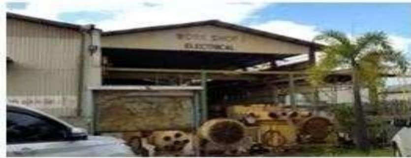
Gambar 1.10 Workshop 1 (Electrical)

Workshop 1 (Electrical) memiliki panjang (L) 50 M x lebar (B) 25 M, Area 1250 m 2 dengan 1 unit OH Crane 3,2 T.