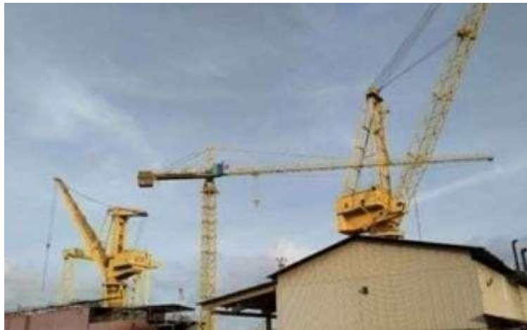
Gambar 1.27 Tower Crane

Tower crane (CT) merupakan alat berat yang dimanfaatkan pada pengerjaan proyek bangunan bertingkat. Fungsi alat ini adalah sebagai alat pemindah material atau material handling equipment . Keuntungan dari penggunaan crane jenis ini ialah, ketinggian dari crane dapat disesuaikan dengan ketinggian dari project yang sedang dikerjakan. Tower Crane yang dimiliki oleh PT. BATAMEC Shipyards memiliki kapasitas maksimum beban yaitu 10 ton.