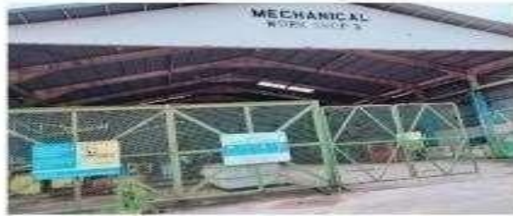
Gambar 1.12 Workshop 3 Mechanical