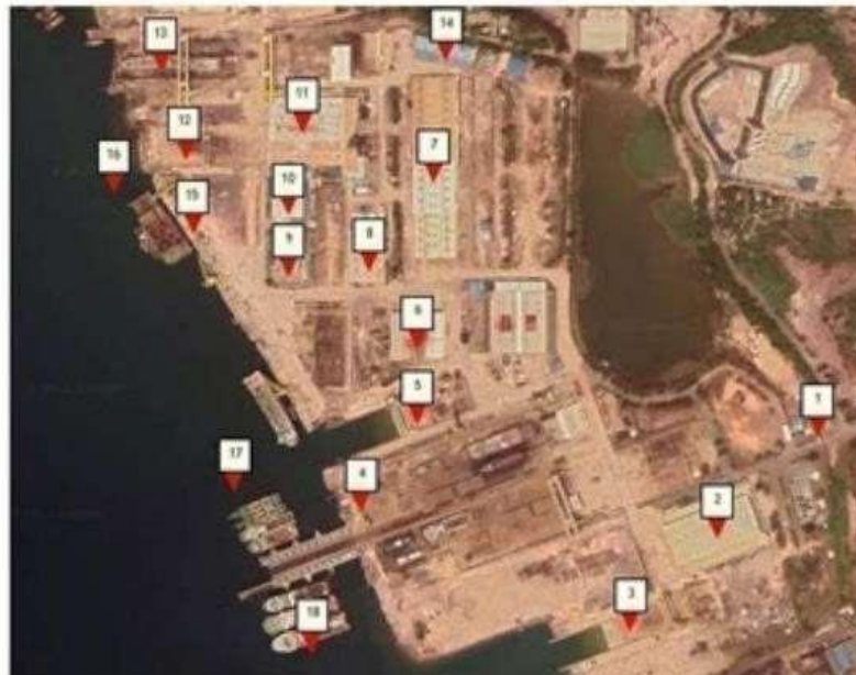
Gambar 1.8 Fasilitas PT. Batamec Shipyards dengan Cintra Satelit