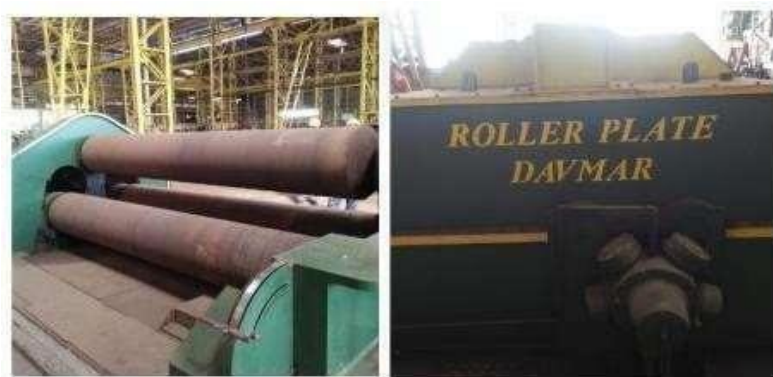
Gambar 1.4 Mesin Rolling