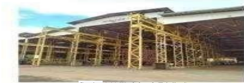
Gambar 1.11 Workshop 2 (Fabrikasi)

Dengan panjang (L) 102 m x lebar (W) 80 m serta terdapat fasilitas frame bending dan cold forming , untuk komponen detailnya diuraikan dibawah.