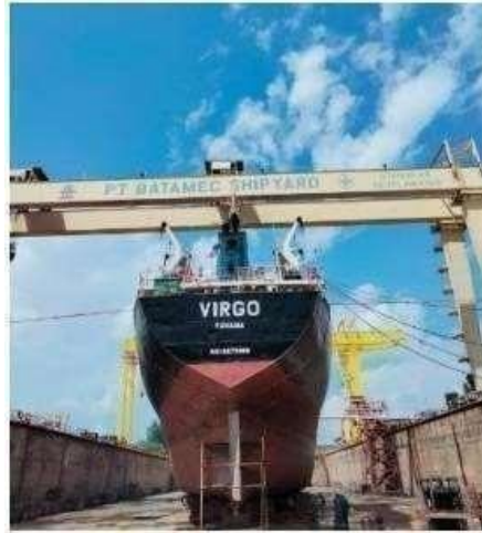
Gambar 1.21 Graving Dock

Size: (L) 145 M x (W) 40 M x (D) 7 M, dengan luas 5000 m 2 dan mempunyai 2 x 160 T Gantry Crane dengan tinggi 32 m dan sebuah Jib Crane 16 Ton.