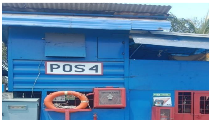
Gambar 1. 11 Pos Keempat