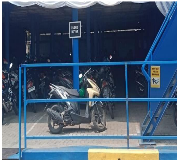
Gambar 1. 14 Area Parkir

Rumah gardu listrik adalah tempat dimana gudang kelistrikan galangan berada dimana didalam terdapat elektrikal-elektrikal yang berfungsi dalam membantu selama pelaksanaan pekerjaan di galangan. Untuk lebih jelasnya dapat dilihat pada gambar 1.15 dibawah ini.