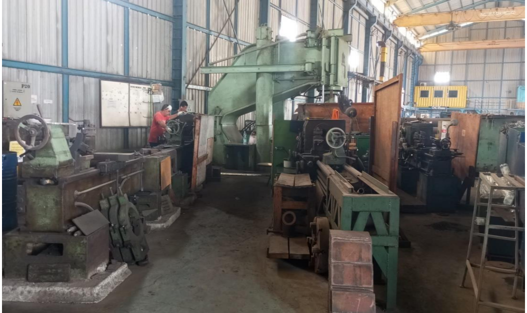
Gambar 1. 4 Workshop

perlengkapan kelistrikan yang dibutuhkan kapal. Untuk lebih jelasnya dapat dilihat pada Gambar 1.4 dibawah ini