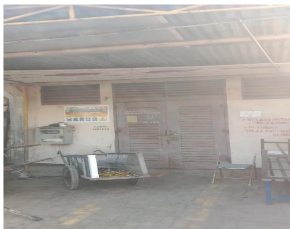
Gambar 1. 15 Rumah Gardu Listrik