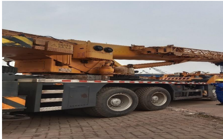
Gambar 1. 5 Mobile Crane