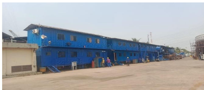
Gambar 1. 13 Mass Karyawan

Perusahaan memberikan fasilitas penginapan gratis untuk karyawan PT. Noahtu Shipyard. Yang mana jika para pekerja tidak memiliki tempat tinggal yang memungkinkan untuk melaksanakan secara efisien maka PT. Noahtu Shipyard sudah menyediakan mass sendiri untuk para karyawannya. Untuk lebih jelasnya dapat dilihat pada Gambar 1.13 dibawah ini.