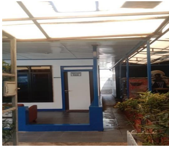
Gambar 1. 12 Mushola

Mushola ini berfungsi sebagai tempat beribadah para pekerja galangan apabila hendak ingin melakukan ibadah sesuai dengan waktu yang memang sudah seharusnya. Untuk lebih jelasnya dapat dilihat pada Gambar 1.12 dibawah ini.