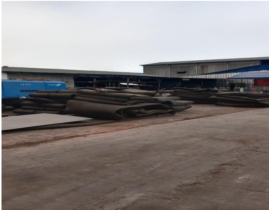
Gambar 1. 3 Airbag

Digunakan untuk docking/undocking kapal berjenis tugboat , LCU dan kapal lainnya dibawah 100 meter dengan menggunakan sistem docking slipway menggunakan airbag . Untuk lebih jelas dapat dilihat pada Gambar 1.3 dibawah ini