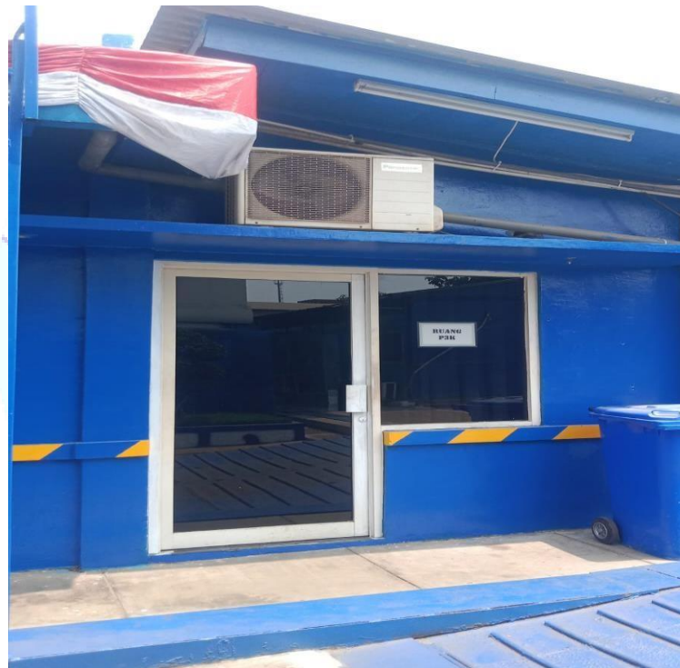
Gambar 1. 16 Ruang P3K

PT. Noahtu Shipyard adalah Perusahaan yang menjaga keamanan serta kenyamanan dan Kesehatan para pekerjanya itulah sebabnya pada perusahaan PT. Noahtu Shipyard dibangun sebuah ruang P3K untuk menjamin apabila pada saat proses pekerjaan ada pekerja yang mengalami sakit ataupun kecelakaan kerja, jadi sebelum dibawa ke rumah sakit terlebih dahulu dirawat di ruang P3K. Untuk lebih jelasnya dapat dilihat pada gambar 1.16 dibawah ini.