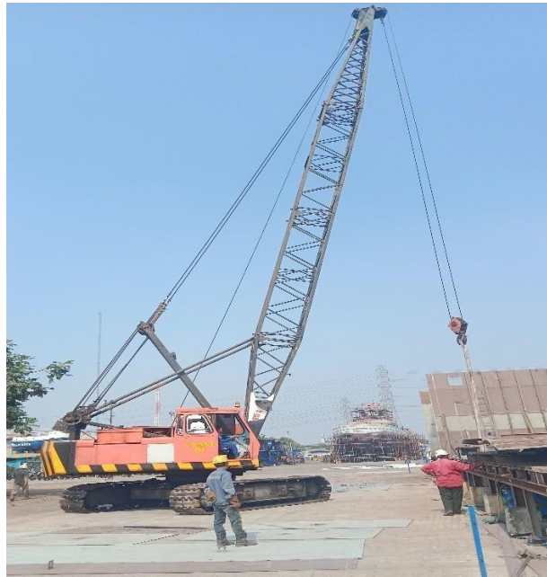
Gambar 1. 7 Crawler Crane

Crawler crane merupakan alat berat pengangkut yang fungsinya mirip dengan mobile crane , crane ini memiliki roda-roda rantai yang dapat digunakan untuk berbagai medan. Untuk lebih jelasnya dapat dilihat pada Gambar 1.7 dibawah ini.