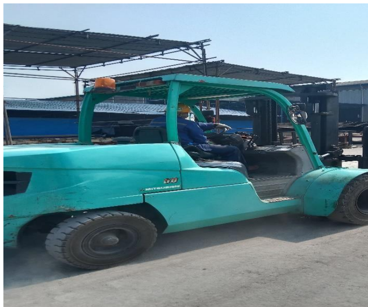
Gambar 1. 6 Forklift

Forklift adalah alat yang memiliki dua garpu yang dipasang pada mast , yang dimana berfungsi untuk mengangkat dan memindahkan barang dari gudang ke lapangan. Pada PT. Noahtu Shipyard memiliki forklift dengan kapasitas 2ton. Untuk lebih jelasnya dapat dilihat pada Gambar 1.6 dibawah ini.