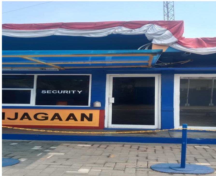
Gambar 1. 8 Pos Utama