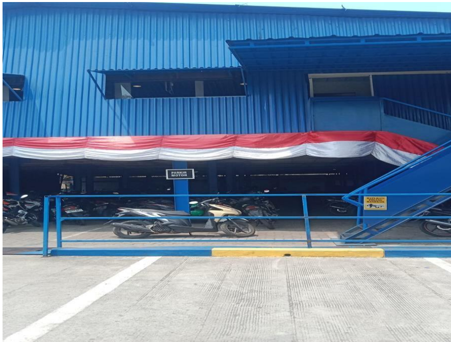
Gambar 1. 2 Main Office

Merupakan kantor utama general manager, tempat kantor yang mengurus karyawan dan sumber daya manusia, dikantor tersebut juga terdapat ruang rapat dan kantor staf karyawan divisi produksi bangunan baru. Untuk lebih jelas dapat dilihat pada Gambar 1.2 dibawah ini.