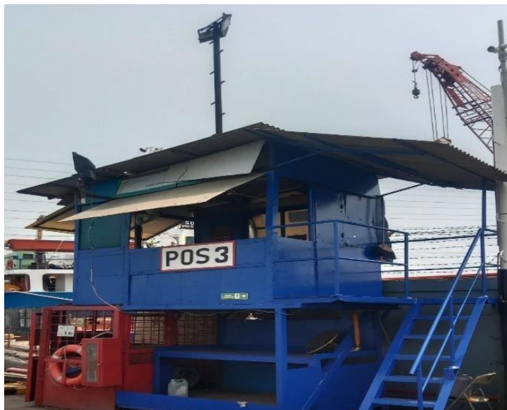
Gambar 1. 10 Pos Ketiga

Pos keempat berada di dekat docking kapal yang terletak di seberang pos tiga, sama dengan pos tiga pos empat ini berfungsi untuk mendata dan memastikan para tamu atau pekerja yang hendak melakukan pekerjaan didalam kapal. Untuk lebih jelasnya dapat dilihat pada Gambar 1.11 dibawah ini.