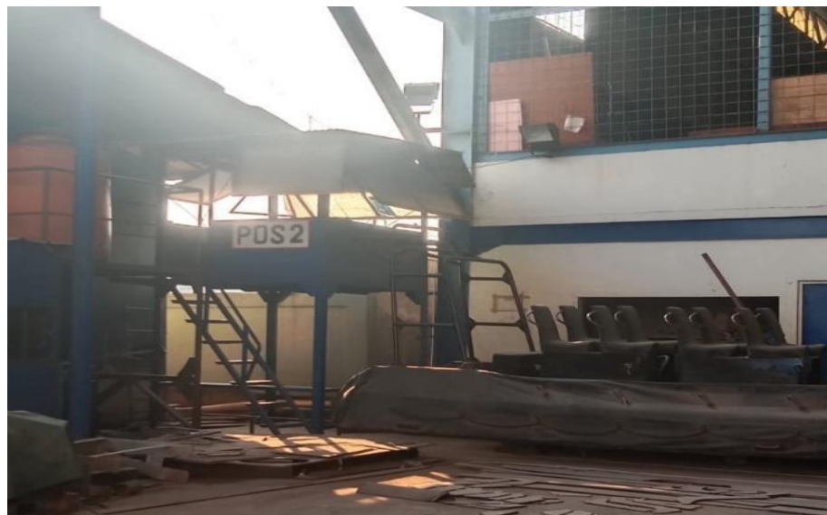
Gambar 1. 9 Pos Kedua