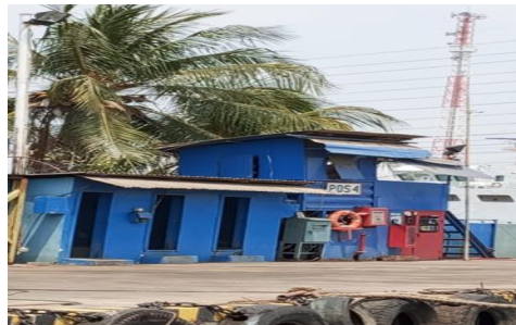
Gambar 1.17 Pos Keempat