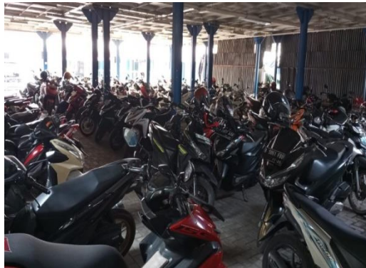
Gambar 1.20 Area Parkir