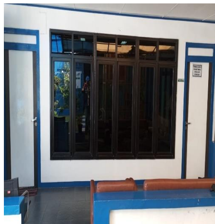
Gambar 1.17 Mushola