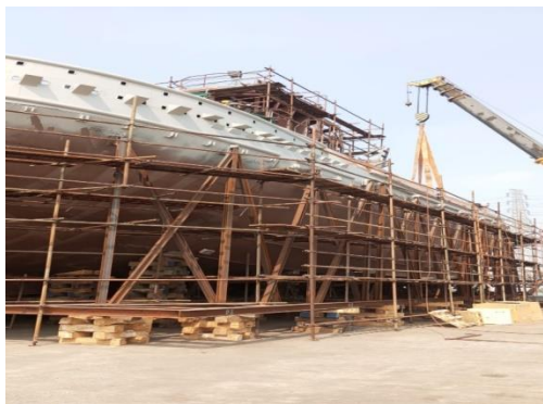
Gambar 1.3 Dock kapal

Dock ini digunakan untuk docking/undocking kapal berjenis Tug Boat dan kapal banyak jenis kapal lainnya dengan menggunakan sistem undocking slipway menggunakan airbag .