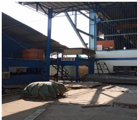
Gambar 1.16 Pos Kedua