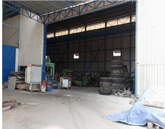
Gambar 1.7 Workshop

Pada workshop mechanical dilakukan proses pengerjaan pemotongan plat kapal, proses bading plat kapal, pembuatan manhole kapal, system perpipaan, pembubutan serta komponen yang dibutuhkan kapal untuk pembuatan kapal bangunan baru.