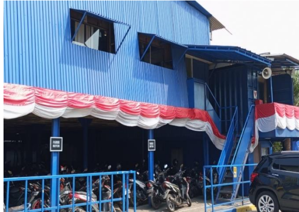
Gambar 1.2 Main Office

Merupakan kantor utama general manager, tempat kantor yang mengurus karyawan dan sumber daya manusia, dikantor tersebut juga terdapat ruang rapat dan kantor staf karyawan divisi produksi bangunan baru.