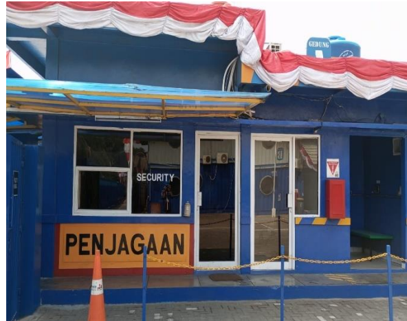
Gambar 1.15 Pos Utama