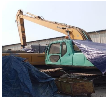
Gambar 1.10 excavator