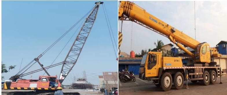
Gambar 1.8 Crane