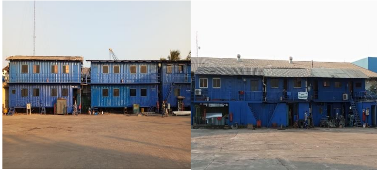
Gambar 1.19 Mass Karyawan

Perusahaan memberikan fasilitas penginapan gratis untuk Pekerja PT. Noahtu Shipyard.