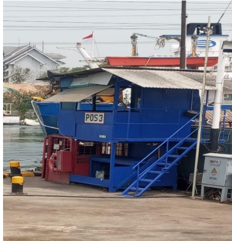
Gambar 1.16 Pos Ketiga