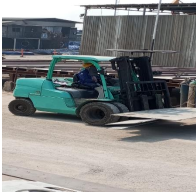
Gambar 1.9 Forklift