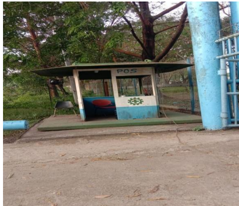
Gambar 1.13 Pos Kedua