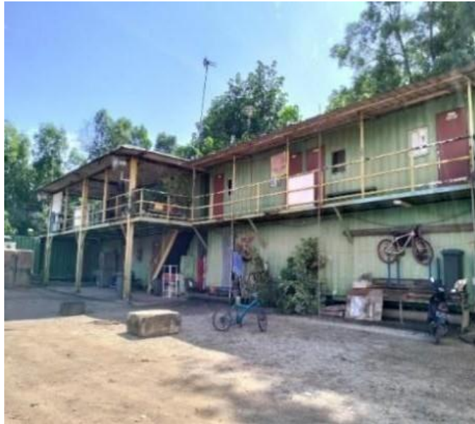
Gambar 1.16 Mess Karyawan

Perusahaan memberikan fasilitas penginapan gratis untuk karyawan PT. Sumringah Berkah Berjaya.