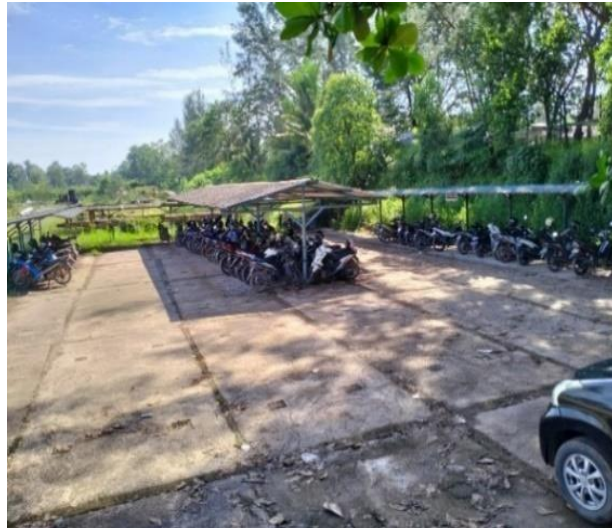
Gambar 1.17 Area Parkir