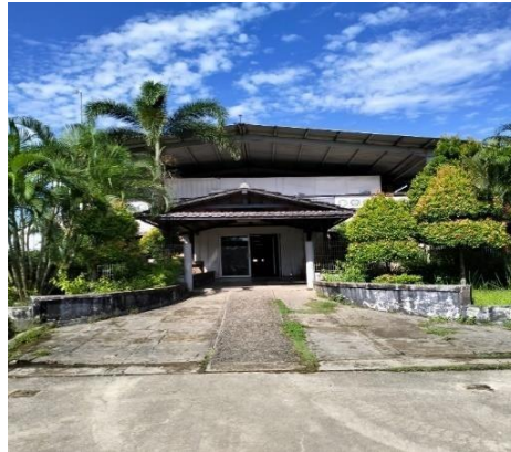
Gambar 1.2 Main Office

Merupakan kantor utama general manager, tempat kantor yang mengurus karyawan dan sumber daya manusia, dikantor tersebut juga terdapat ruang rapat dan kantor staf karyawan divisi produksi bangunan baru.