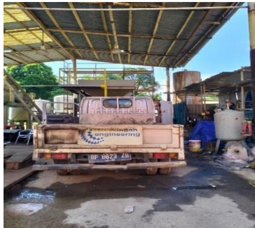
Gambar 1.7 Truck