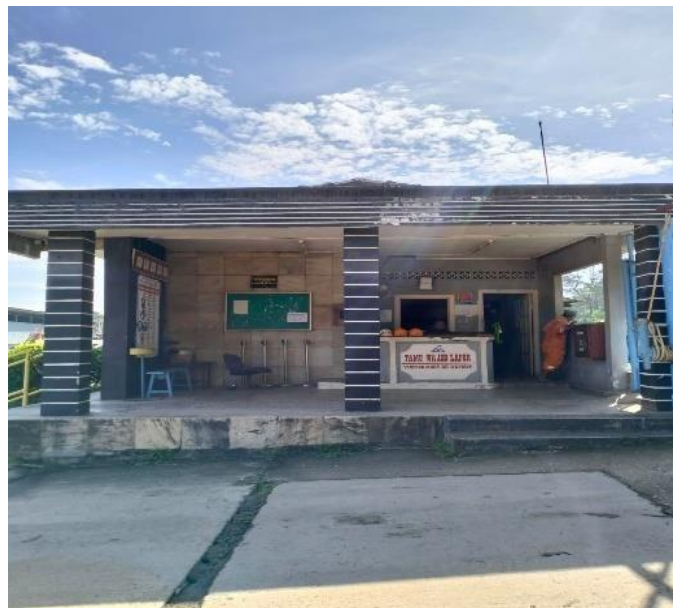
Gambar 1.12 Pos Utama