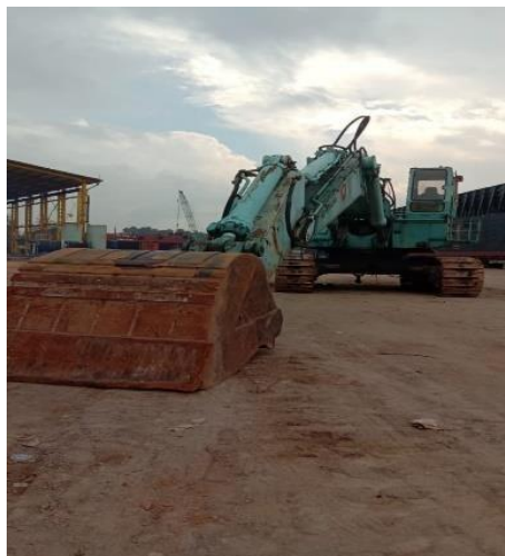
Gambar 1.8 Excavator