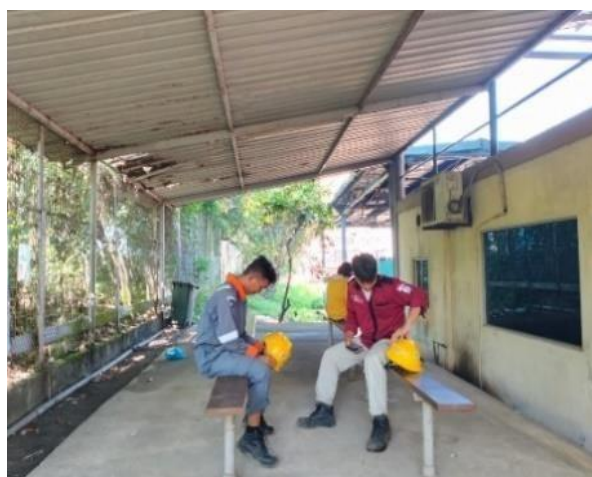
Gambar 1.15 Kantin