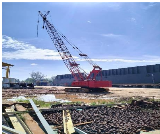
Gambar 1.5 Crane