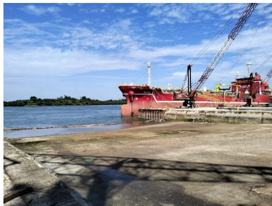
Gambar 1.3 Dock 1

Digunakan untuk docking/undocking kapal dengan menggunakan sistem docking menggunakan airbag .