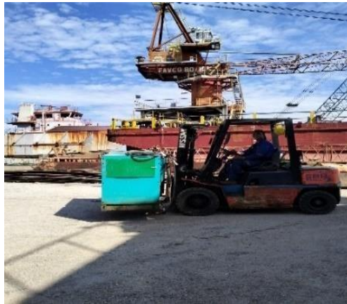
Gambar 1.6 Forklift