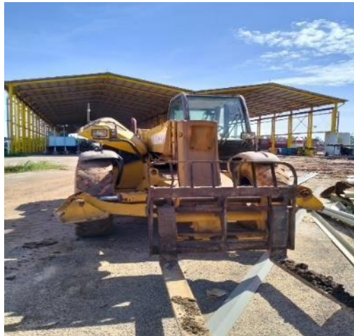
Gambar 1.9 Maniscopic