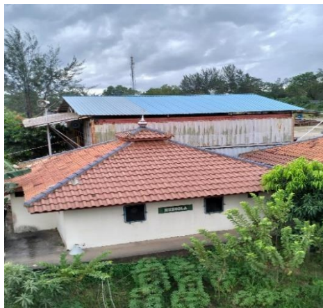
Gambar 1.14 Mushola