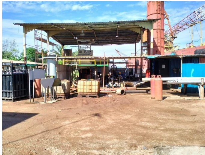
Gambar 1.4 Workshop

Pada workshop mechanical dilakukan proses pengerjaan reparasi mesin-mesin kapal seperti sistem propulsi, perpipaan, valve dan equipment. Disebelahnya ada workshop electrical yang menyimpan komponen perlengkapan kelistrikan yang dibutuhkan untuk memperbaiki sistem electrical pada kapal.