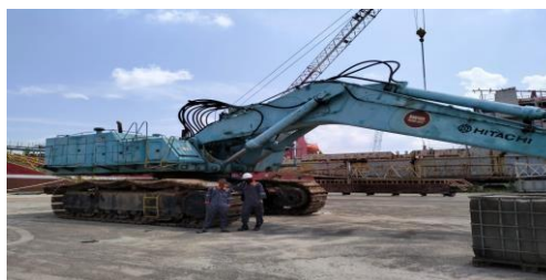
Gambar 1.8 Excavator