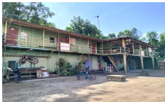
Gambar 1.16 Mass Karyawan

Perusahaan memberikan fasilitas penginapan gratis untuk karyawan PT. Sumringah Berkah Berjaya.