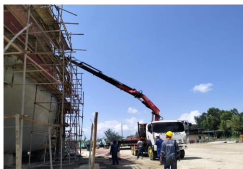
Gambar 1.11 Manlift