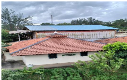
Gambar 1.14 Mushola