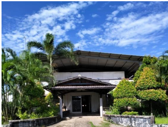
Gambar 1.2 Main Office

Merupakan kantor utama general manager, tempat kantor yang mengurus karyawan dan sumber daya manusia, dikantor tersebut juga terdapat ruang rapat dan kantor staf karyawan divisi produksi bangunan baru.