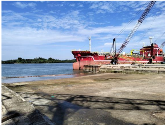
Gambar 1.3 DOCK