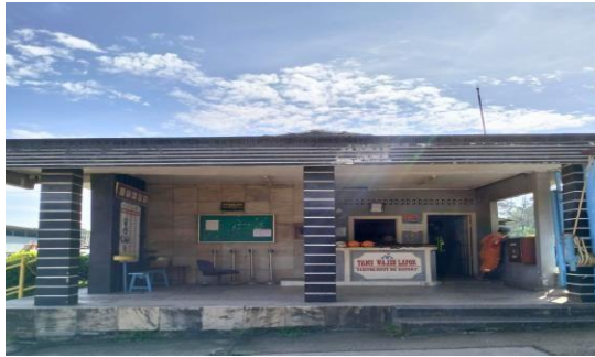
Gambar 1.12 Pos Utama