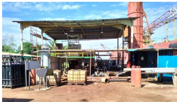
Gambar 1.4 Workshop

Pada workshop mechanical dilakukan proses pengerjaan reparasi mesin-mesin kapal seperti sistem propulsi, perpipaan, valve dan equipment. Disebelahnya ada workshop electrical yang menyimpan komponen perlengkapan kelistrikan yang dibutuhkan kapal.