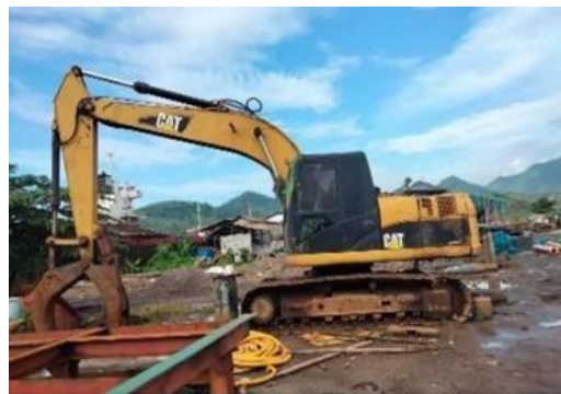
Gambar 1.10 Wheel Loader