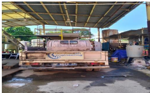
Gambar 1.7 Truck