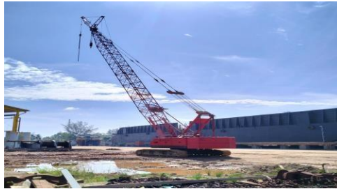
Gambar 1.5 Crane