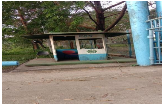
Gambar 1.13 Pos Kedua