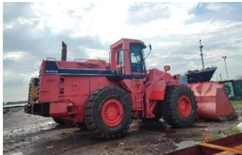
Gambar 1.9 Cimolai