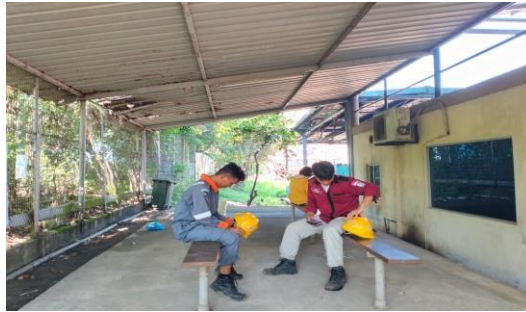
Gambar 1.15 Kantin