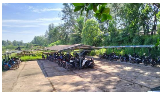
Gambar 1.17 Area Parkir