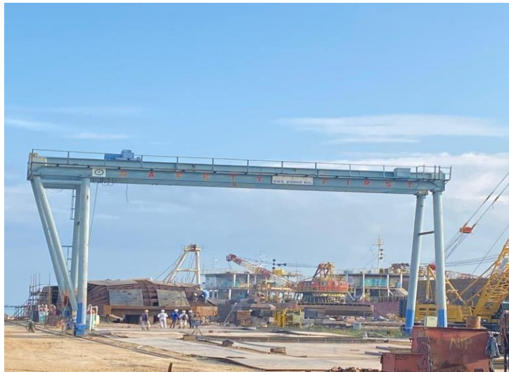
Gambar 1 3 Gantry Crane

Gantry Crane merupakan hoist crane yang memiliki tempat kaki beroda dan bergerak diatas rel yang digunakan untuk mengangkat beban. Adapun gambar Gantry crane dapat di lihat pada Gambar 1.3