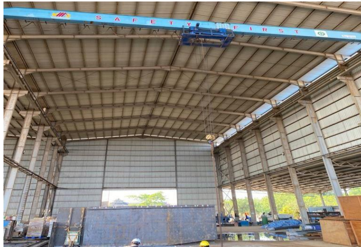
Gambar 1 4 Overhead Crane