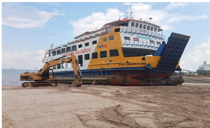
Gambar 1 2 Slip Way

Fasilitas slip way yang di gunakan di sini adalah ballon, dimana ballon ini di gunakan untuk proses penaikan dan penurunan kapal dan untuk spesifikasi ballon untuk materialnya natural rubber dengan diameter 0.6- 2.8 m dan panjang 5-24 m. adapun gambar slip way bisa dilihat pada gambar 1.2.