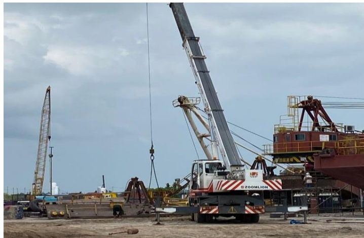
Gambar 1 5 Crawler Crane

Crawler Crane merupakan alat angkat yang dapat berpindah dan memiliki keunggulan bekerja di permukaan yang lunak. Adapun gambar Crawler Crane dapat di lihat pada Gambar 1.5