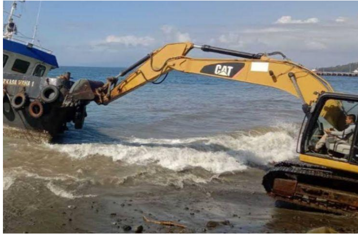
Gambar 1 6 Excavator

sebagai alat keruk, serta tenaga penggerak hidrolik. Adapun gambar Excavator dapat di lihat pada Gambar 1.6