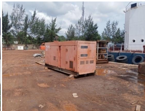
Gambar 1. 8 Listrik PLN