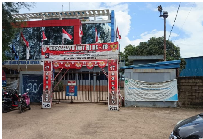
Gambar 1. 3 Pintu gerbang utama