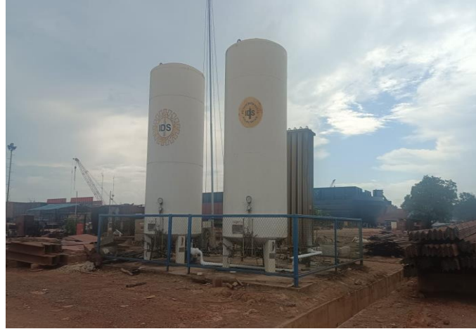
Gambar 1. 6 Tangki Co2

Untuk kebutuhan Oksigen Co2 terminal khusus (Tersus) PT Karya Teknik Utama menggunakan tangki suplayer Co2. Untuk lebih jelasnya fasilitas tangki suplayer Co2 yang berada di PT Karya Teknik Utama , dapat kita lihat pada Gambar 1.6.