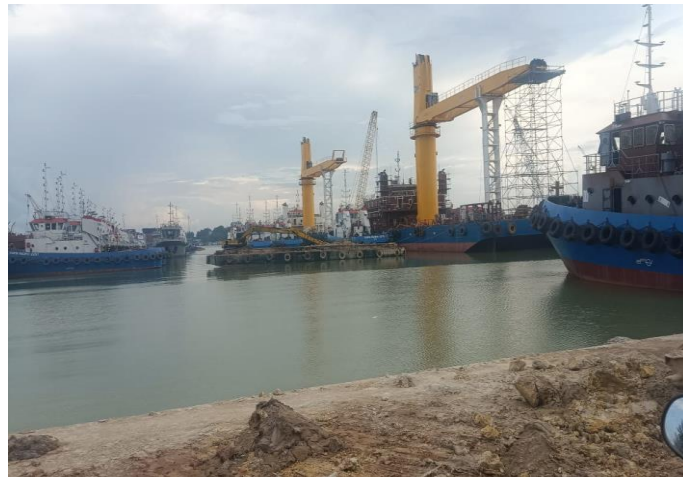
Gambar 1. 9 Jetty

Dermaga yang terdapat di PT. Karya Teknik Utama ini adalah tambat. Untuk lebih jelasnya fasilitas dermaga atau jetty yang berada di PT. Karya Teknik Utama, dapat kita lihat pada Gambar 1.9.