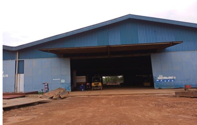
Gambar 1. 16 Bengkel bending

Bengkel yang dapat digunakan untuk menekuk material seperti plat dan pipa yang diperlukan dalam sebuah bangunan baru kapal serta item-item yang melengkung yang dibutuhkan, dapat kita lihat pada Gambar 1.17.