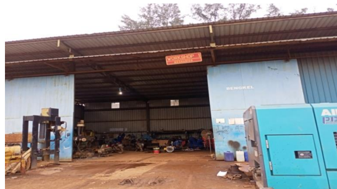
Gambar 1. 10 Workshop

Whorkshop tempat untuk melakukan perbaikan pada mesin kendaraan berat yang rusak atau mau dilkakukan serfis pada mesin kendaraan yang digunakan dalam proses distribusi dan pabrikasi kapal baik untuk kapal bangunan baru maupun perbaikan.Untuk lebih jelasnya fasilitas workshop yang berada di PT Karya Teknik Utama, dapat kita lihat pada Gambar 1.10.