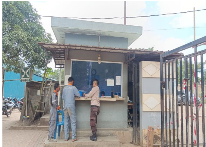
Gambar 1. 4 Pos utama

berada disisi bagian depan main office dan sebelah timur dari pos utama. Merupakan salah satu akses masuk ke fasilitas pelabuhan dari darat. Untuk lebih jelasnya aktivitas pos utama yang berada di PT Karya Teknik Utama, dapat kita lihat pada Gambar 1.4.