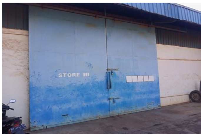
Gambar 1. 12 Store III

Store III adalah tempat untuk menyimpan barang peralatan kapal seperti tali tambat, propeller kapal dan lainnya yang berhubungan dengan peralatan dalam sebuah kapal, dapat kita lihat pada Gambar 1.12.