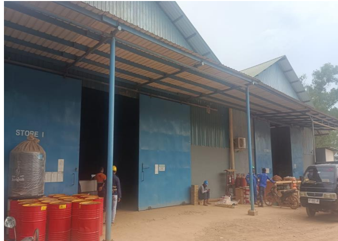
Gambar 1. 11 Store I & II

Store I dan II ini merupakan tempat dimana difungsikan sebagai penyimpanan barang seperti aksesoris untuk kapal, mesin-mesin kapal dan alat kelistrikan kapal. Untuk lebih jelasnya fasilitas gudang yang berada di PT. Karya Teknik Utama, dapat kita lihat pada Gambar 1.11