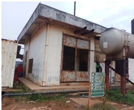
Gambar 1. 7 Generator set

Selain itu adalagi fasilitas untuk listrik dari PLN dan generator set . Untuk lebih jelasnya fasilitas PLN yang berada di PT. Karya Teknik Utama, dapat kita lihat pada Gambar 1.7 dan 1.8.