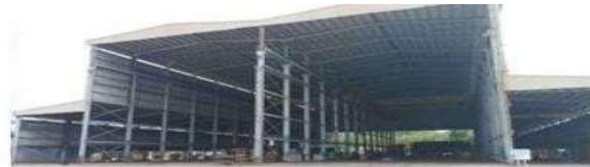
Gambar 1.16 Workshop 6 dan 7

Dengan panjang 107 m (L) x lebar (W) 74 m total area 7918 m 2 juga memiliki fasilitas pendukung yaitu 2 unit OH Crane 30 T dan 4 unit OH Crane 10 T