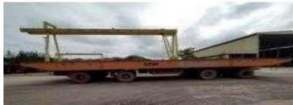
Gambar 1.23 Heavy load Transporter