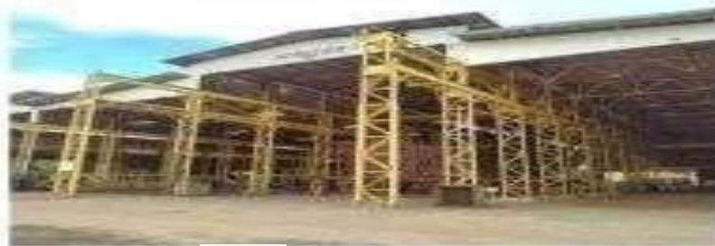
Gambar 1.11 Workshop 12 (Fabrikasi)

Dengan panjang (L) 102 m x lebar (W) 80 m serta terdapat fasilitas frame bending dan cold forming , untuk komponen detailnya diuraikan dibawah.