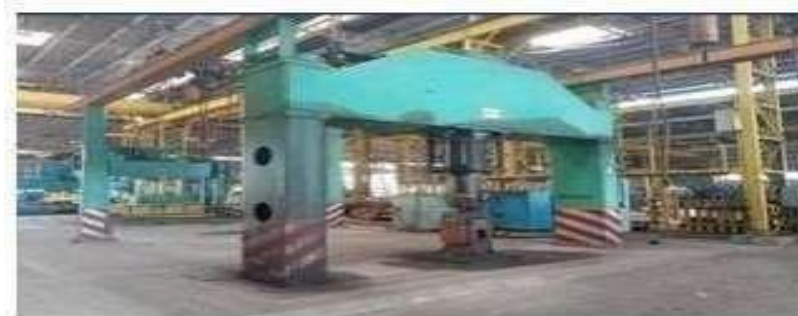
Gambar 1.5 Mesin Press