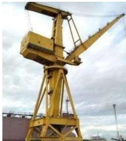
Gambar 1.26 Jib Crane

Crane Jib Crane sangat berguna untuk mobilitas pemindahan barang berat seperti pada dermaga, Dry Dock , Slipway maupun pembangunan kapal baru. Terdapat 8 unit Jib Crane yang dimiliki oleh PT. BATAMEC Shipyard dengan kapasitas minimum 10 ton dan maksimum 50 ton.