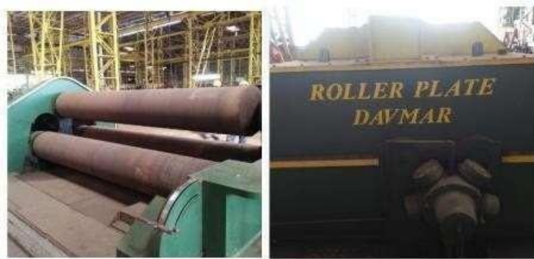
Gambar 1. 4 Mesin Rolling