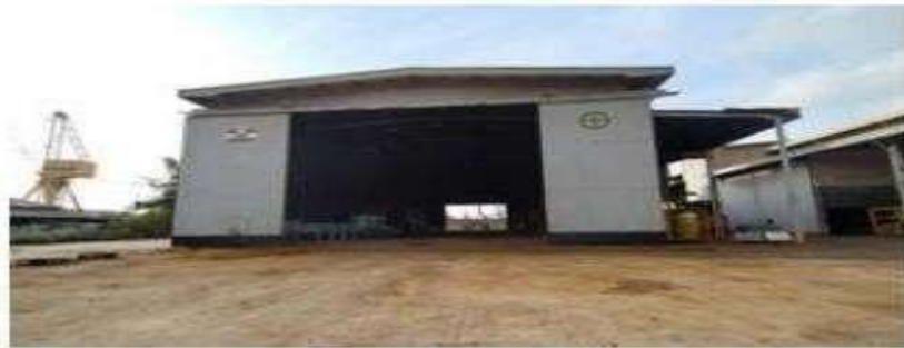
Gambar 1.18 Chamber blasting 1