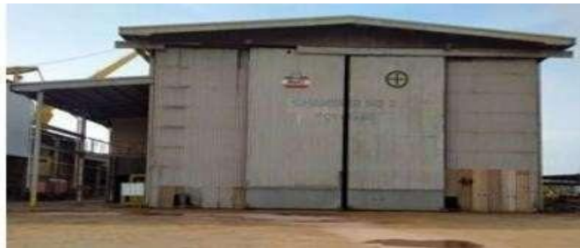
Gambar 1.19 Chamber blasting 2