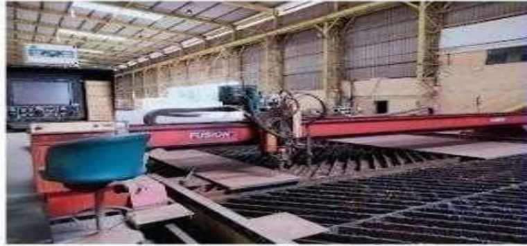
Gambar 1.7 Mesin CNC