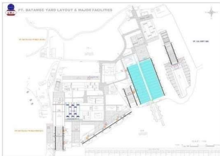
Gambar 1.1 Denah Lokasi perusahaan

Untuk kegiatan usahanya, PT. BATAMEC Shipyards menggunakan lahan seluas 60 Ha yang mana \pm 40 Ha dijadikan sebagai operasional dan lebihnya dijadikan sebagai lahan hijau dan sarana lainnya. Keterangan selengkapnya mengenai penggunaan lahan PT. BATAMEC Shipyards dijelaskan pada Tabel 1.1 berikut :