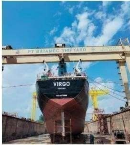
Gambar 1.21 Graving Dock

Size: (L) 145 M x (W) 40 M x (D) 7 M, dengan luas 5000 m 2 dan mempunyai 2 x 160 T Gantry Crane dengan tinggi 32 m dan sebuah Jib Crane 16 Ton.