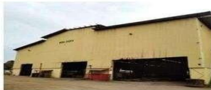
Gambar 1.13 Workshop 4

Dengan panjang (L) 139 m x lebar (W) 49 m serta terdapat 3 nos CNC Cutting Machine .