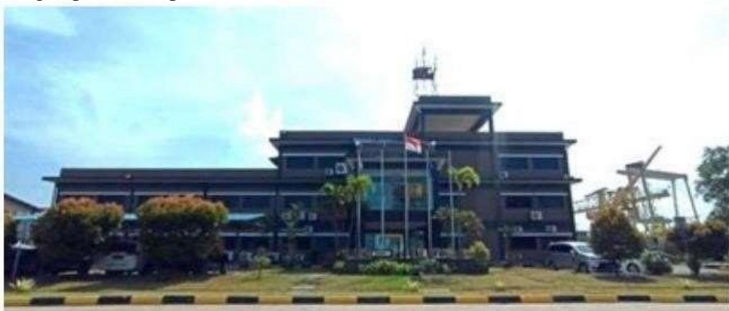
Gambar 1. 9 Kantor utama PT. Batamec Shipyard

Kantor Batamec terletak di sisi barat dekat pantai. Kantor Ini digunakan untuk semua kegiatan administratif. Kantor ini digunakan dalam perencanaan galangan kapal, penjadwalan, koordinasi pekerjaan, serta tempat rapat dan diskusi bersama dengan pemilik kapal.