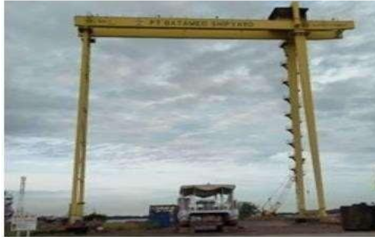
Gambar 1.25 Gantry crane