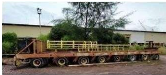
Gambar 1.24 Sarry Transporter