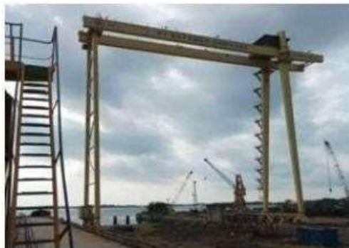
Gambar 1.22 Slipway

a) New Slip Way 1 (L) 125 M x (W) 40 M , 1 unit dengan luas 5000 m 2 dan mempunyai 80 Ton GantryCrane dengan tinggi (H) 24 m.