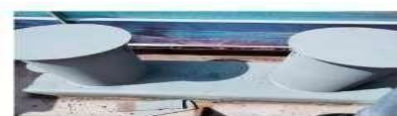
Gambar 1.6 Bollard