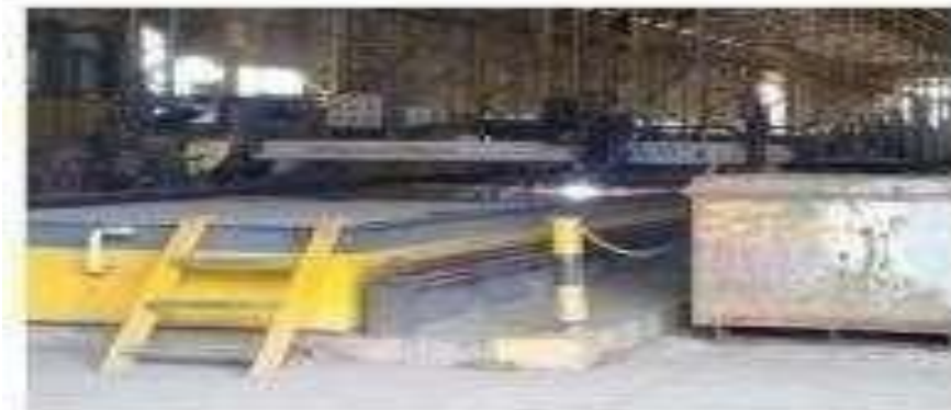
Gambar 1.14 CNC Hypertherm Plasma