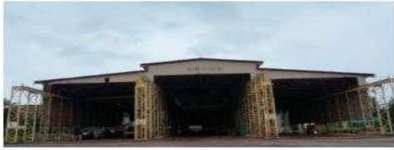
Gambar 1.15 Workshop 5

Dengan panjang (L) 78 m x lebar (W) 49 m serta terdapat 5 unit OH Crane 10T. Digunakan untuk fabrikasi block, baik oleh main contractor maupun sub contractor .