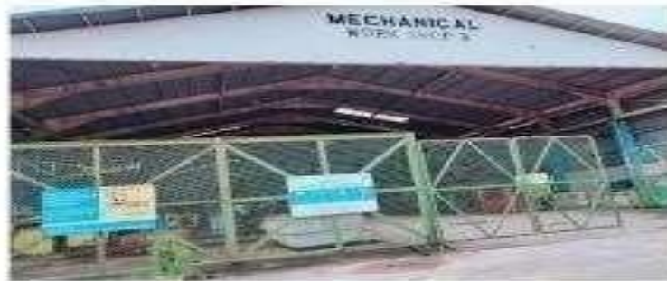
Gambar 1.12 Workshop 3 Mechanical