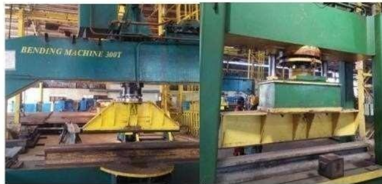
Gamabr 1. 3 Mesin Bending