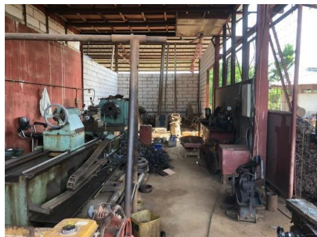
Gambar 1 4 Bengkel bubut

Bengkel bubut ini dipakai untuk keperluan barang yang akan dibubut seperti, as propeller kapal, as kemudi kapal dan pembuatan as propeller serta kemudi yang baru. Adapun bengkel bubut seperti yang ditunjukkan pada Gambar 1.4