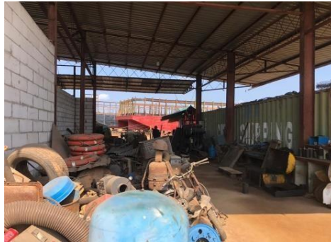
Gambar 1 5 Bengkel Mesin

Bengkel ini digunakan untuk sebagai tempat perbaikan mesin yang rusak mulai dari mesin kapal hingga mesin excavator . Adapun bengkel mesin seperti yang ditunjukkan pada Gambar 1.5