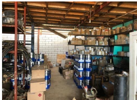
Gambar 1 2 Gudang logistik

Fasilitas gudang logistik ini digunakan untuk menyimpan berbagai barang persediaan yang dibutuhkan dalam keberlangsungan pekerjaan yang dilakukan diperusahaan seperti, amplas, elektroda, gerinda dan alat dan bahan lainnya. Adapun gudang logistik seperti yang ditunjukkan pada Gambar 1.2