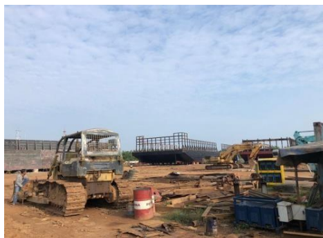
Gambar 1 6 Lahan galangan

Lahan tanah lapang ini digunakan sebagai area penempatan tongkang dan tug boat yang naik dan akan diperbaiki sesuai kerusakan yang terjadi. Adapun lahan galangan seperti yang ditunjukkan pada Gambar 1.6