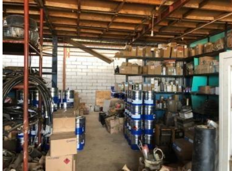
Gambar 1 3 Gudang penyimpanan cat

keberlangsungan proses pengecatan diperusahaan. Adapun gudang penyimpanan cat seperti yang ditunjukkan pada Gambar 1.3