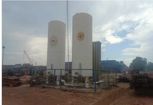
Gambar 1. 6 Tangki Co2

Untuk kebutuhan Oksigen Co2 terminal khusus (Tersus) PT Karya Teknik Utama menggunakan tangki suplayer Co2. Untuk lebih jelasnya fasilitas tangki suplayer Co2 yang berada di PT Karya Teknik Utama , dapat kita lihat pada Gambar 1.6.