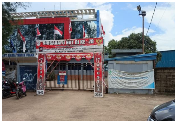
Gambar 1. 3 Pintu gerbang utama