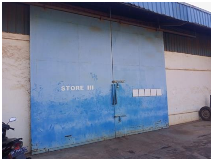
Gambar 1. 11 Store III

Store III adalah tempat untuk menyimpan barang peralatan kapal seperti tali tambat, propeller kapal dan lainnya yang berhubungan dengan peralatan dalam sebuah kapal, dapat kita lihat pada gambar 1.11.