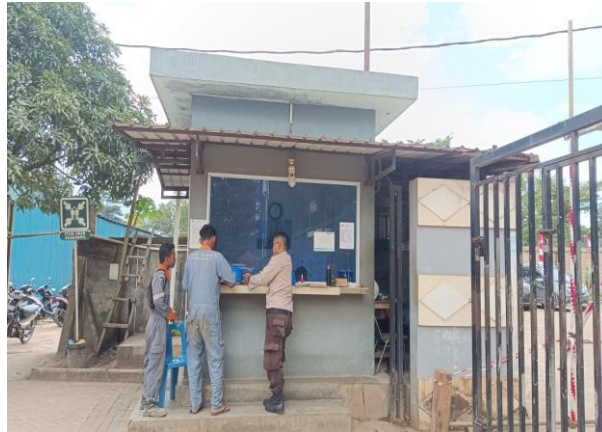
Gambar 1. 4 Pos utama

Terminal khusus (Tersus) PT. Karya Teknik Utama saat ini mempunyai 2 buah pos security, yaitu : pos utama dan pos 2, terletak di Pintu gerbang dan berada disisi bagian depan main office dan sebelah timur dari pos utama. Merupakan salah satu akses masuk ke fasilitas pelabuhan dari darat. Untuk lebih jelasnya aktivitas pos utama yang berada di PT Karya Teknik Utama, dapat kita lihat pada Gambar 1.4.