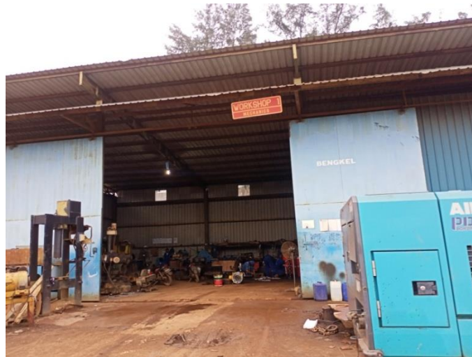
Gambar 1. 9 Workshop

Whorkshop tempat untuk melakukan perbaikan pada mesin kendaraan berat yang rusak atau mau dilkakukan serfis pada mesin kendaraan yang digunakan dalam proses distribusi dan pabrikasi kapal baik untuk kapal bangunan baru maupun perbaikan. Untuk lebih jelasnya fasilitas workshop yang berada di PT Karya Teknik Utama, dapat kita lihat pada Gambar 1.9.