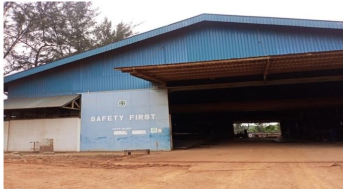
Gambar 1. 14 Bengkel auto blast