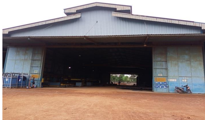
Gambar 1. 13 Bengkel CNC

Bengkel ini merupakan bengkel yang menggunakan sistem otomasi mesin perkakas yang dioperasikan oleh perintah yang diprogram secara abstrak untuk proses fabrikasi bahan yang diperlukan sebuah kapal tongkang atau Tugboat serta untuk keperluan lainnya, dapat kita lihat pada gambarl 1.13.