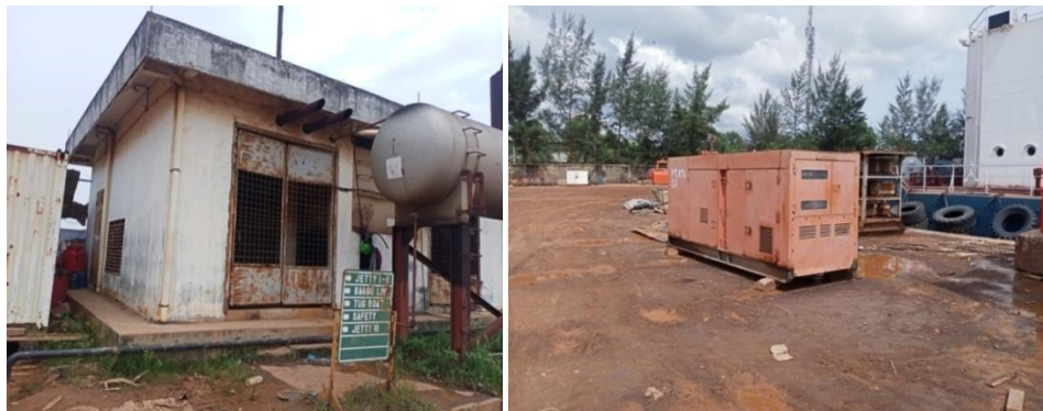
Gambar 1. 7 Generator set dan listrik PLN

Selain itu adalagi fasilitas untuk listrik dari PLN dan generator set . Untuk lebih jelasnya fasilitas PLN yang berada di PT. Karya Teknik Utama, dapat kita lihat pada Gambar 1.7.