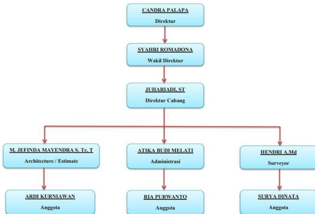
Gambar 1.1 Struktur organisasi proyek CV. Jack Consultant