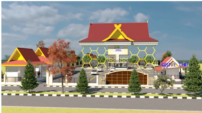
Gambar 1. 1 Proyek Pembangunan Pembangunan Kantor UPT Pengelolaan Pendapatan Dumai

Selain faktor keamanan bangunan yang sudah tua, tujuan lainnya dari pembangunan proyek gedung ini dapat memberikan kenyamanan kepada pengguna layanan di kota Dumai, khususnya layanan pembayaran pajak kendaraan bermotor yang berdampak pada meningkatnya pendapatan asli daerah (PAD) Provinsi Riau.