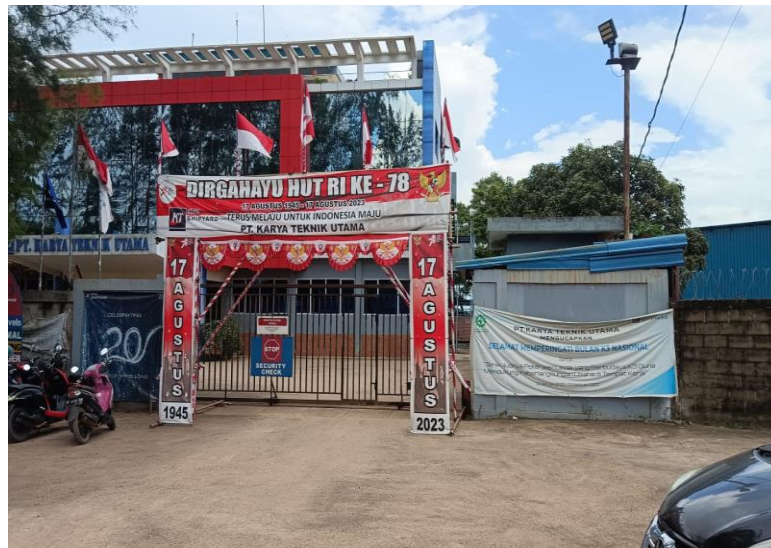
Gambar1. 3 Pintu gerbang utama

c. Akses dari laut melalui perairan selat dan masuk melalui dermaga/ Jetty terminal khusus (Tersus) PT. Karya Teknik Utama.