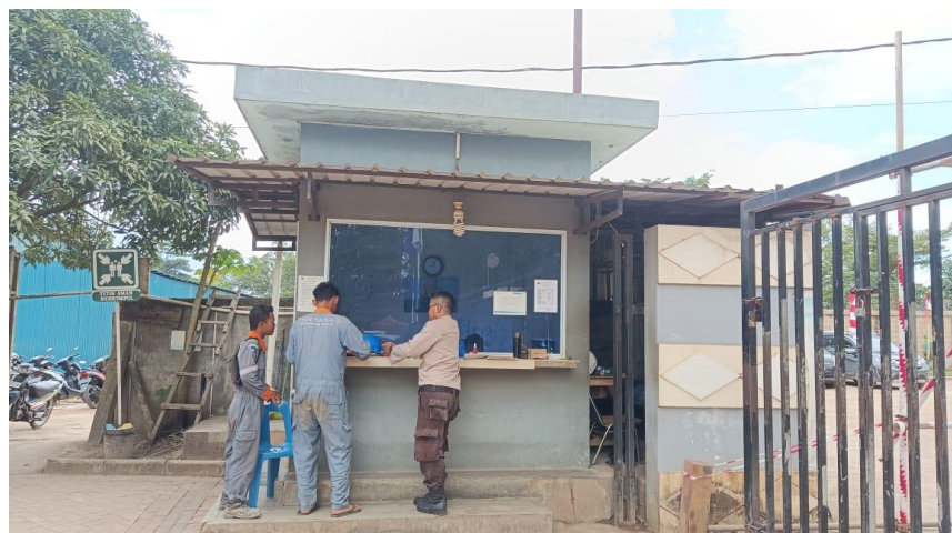
Gambar1. 4 Pos utama

Terminal khusus (Tersus) PT. Karya Teknik Utama saat ini mempunyai 2 buah pos security, yaitu : pos utama dan pos 2, terletak di Pintu gerbang dan berada disisi bagian depan main office dan sebelah timur dari pos utama. Merupakan salah satu akses masuk ke fasilitas pelabuhan dari darat. Untuk lebih jelasnya aktivitas pos utama yang berada di PT Karya Teknik Utama, dapat kita lihat pada Gambar 1.4.