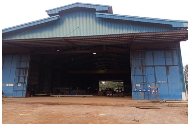
Gambar1. 13 Bengkel bubut

Bengkel ini menggunakan mesin utama mesin bubut untuk keperluan pembubutan pada shaf propeller tugboat dan kepentingan lainnya yang mengandalkan mesin bubut, dapat kita lihat pada Gambar 1.13.