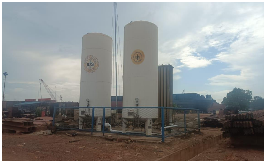
Gambar1. 6 Tangki Co2

Untuk kebutuhan Oksigen Co2 terminal khusus (Tersus) PT Karya Teknik Utama menggunakan tangki suplayer Co2. Untuk lebih jelasnya fasilitas tangki suplayer Co2 yang berada di PT Karya Teknik Utama, dapat kita lihat pada Gambar 1.6.