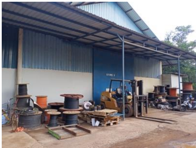
Gambar1. 11 Store

Store I dan II ini merupakan tempat dimana difungsikan sebagai penyimpanan barang seperti aksesoris untuk kapal, mesin-mesin kapal dan alat kelistrikan kapal. Untuk lebih jelasnya fasilitas gudang yang berada di PT. Karya Teknik Utama, dapat kita lihat pada Gambar 1.11