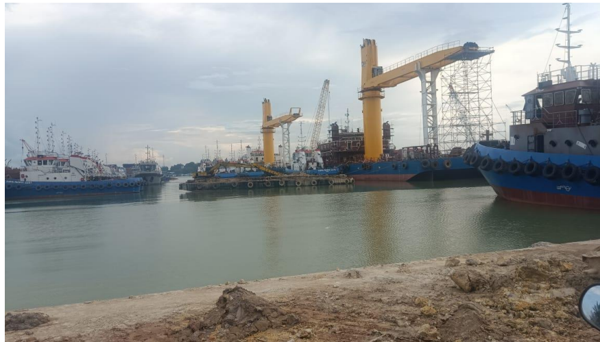
Gambar1. 9 Jetty

Dermaga yang terdapat di PT. Karya Teknik Utama ini adalah tambat. Untuk lebih jelasnya fasilitas dermaga atau jetty yang berada di PT. Karya Teknik Utama, dapat kita lihat pada Gambar 1.9.