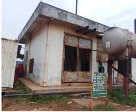
Gambar1. 7 Generator set

Selain itu adalah fasilitas untuk listrik dari PLN dan generator set . Untuk lebih jelasnya fasilitas PLN yang berada di PT. Karya Teknik Utama, dapat kita lihat pada Gambar 1.7 dan 1.8.