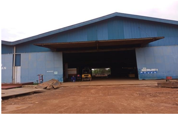
Gambar1. 16 Bengkel bending

Bengkel yang dapat digunakan untuk menekuk material seperti plat dan pipa yang diperlukan dalam sebuah bangunan baru kapal serta item-item yang melengkung yang dibutuhkan, dapat kita lihat pada Gambar 1.16.