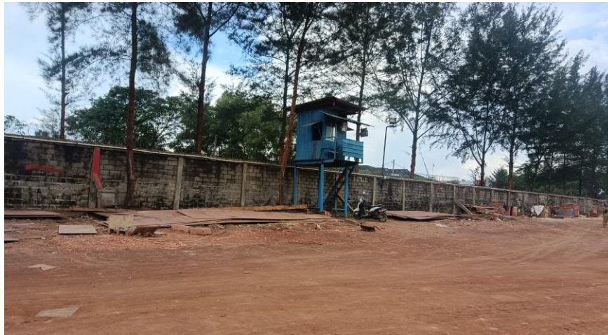
Gambar1. 5 Pos pantau

Pos pantau terletak di beberapa titik dilapangan KTU Shipyards, untuk memantau keamanan di fasilitas pelabuhan dan di sekitar perairan dan tempat fabrikasi. Untuk lebih jelasnya aktivitas pos pantau yang berada di PT Karya Teknik Utama, dapat kita lihat pada Gambar 1.5.