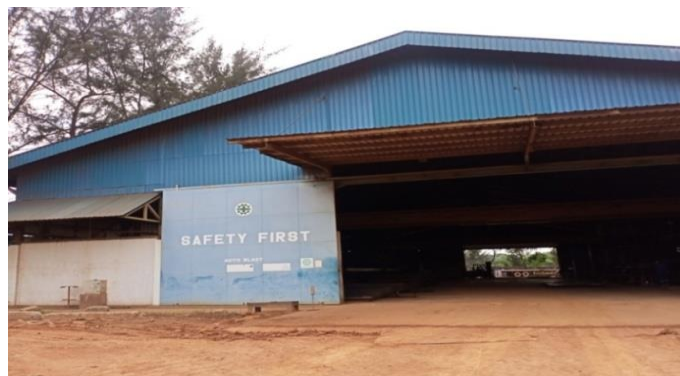
Gambar1. 15 Bengkel auto blast

Bengkel auto blast merupakan bengkel yang mempunyai mesin blasting yang metodenya efektif untuk menghilangkan kontamina permukaan, membersihkan dan menghaluskan permukaan yang halus sebelum menerapkan primer atau pelapis pada bahan yang diperlukan sebuah bangunan baru kapal, dapat kita lihat pada Gambar 1.15.