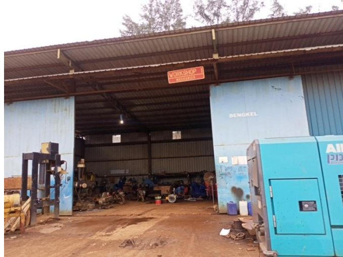
Gambar1. 10 Workshop

bangunan baru maupun perbaikan. Untuk lebih jelasnya fasilitas workshop yang berada di PT Karya Teknik Utama, dapat kita lihat pada Gambar 1.10.