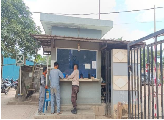
Gambar 1. 4 Pos utama

Pos pantau terletak di beberapa titik dilapangan KTU Shipyard, untuk memantau keamanan di fasilitas pelabuhan dan di sekitar perairan dan tempat fabrikasi. Untuk lebih jelasnya aktivitas pos pantau yang berada di PT Karya Teknik Utama, dapat kita lihat pada Gambar 1.5.