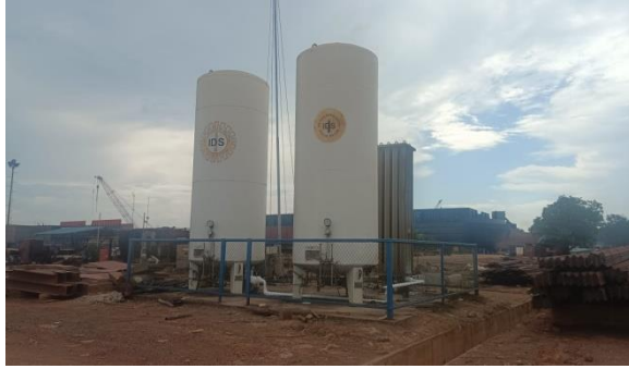
Gambar 1. 6 Tangki Co2

Selain itu adalagi fasilitas untuk listrik dari PLN dan generator set . Untuk lebih jelasnya fasilitas PLN yang berada di PT. Karya TeknikUtama, dapat kita lihat pada Gambar 1.7 dan 1.8.