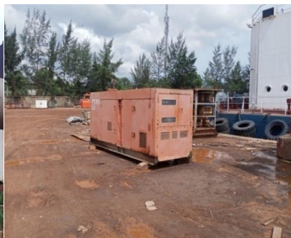
Gambar 1. 8 Listrik PLN