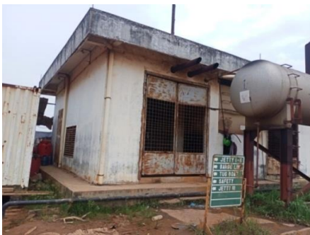
Gambar 1. 7 Generator set

Selain itu adalagi fasilitas untuk listrik dari PLN dan generator set . Untuk lebih jelasnya fasilitas PLN yang berada di PT. Karya TeknikUtama, dapat kita lihat pada Gambar 1.7 dan 1.8.