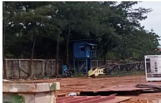
Gambar 1. 5 Pos pantau

Pos pantau terletak di beberapa titik dilapangan KTU Shipyard, untuk memantau keamanan di fasilitas pelabuhan dan di sekitar perairan dan tempat fabrikasi. Untuk lebih jelasnya aktivitas pos pantau yang berada di PT Karya Teknik Utama, dapat kita lihat pada Gambar 1.5.