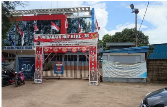
Gambar 1. 3 Pintu gerbang utama