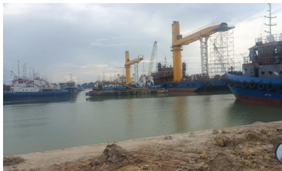
Gambar 1. 9 Jetty

Dermaga yang terdapat di PT. Karya Teknik Utama ini adalah tambat. Untuk lebih jelasnya fasilitas dermaga atau jetty yang berada di PT. Karya Tekhnik Utama, dapat kita lihat pada Gambar 1.9.