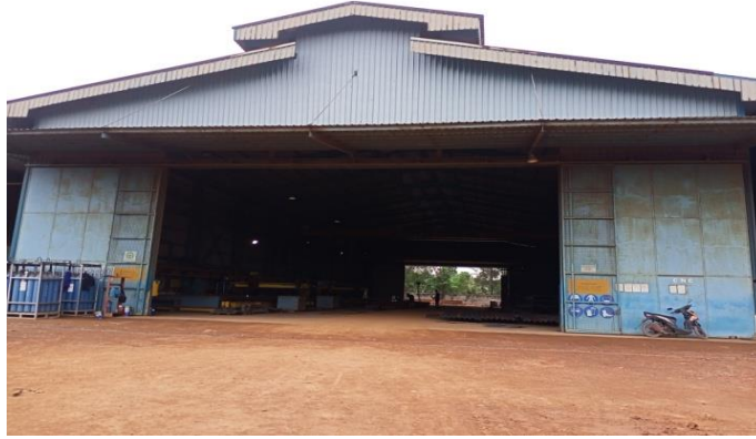
Gambar 1. 14 Bengkel CNC

Bengkel ini merupakan bengkel yang menggunakan sistem otomasi mesin perkakas yang dioperasikan oleh perintah yang diprogram secara abstrak untuk proses fabrikasi bahan yang diperlukan sebuah kapal tongkang atau Tugboat serta untuk keperluan lainnya, dapat kita lihat pada Gambar 1.14 .