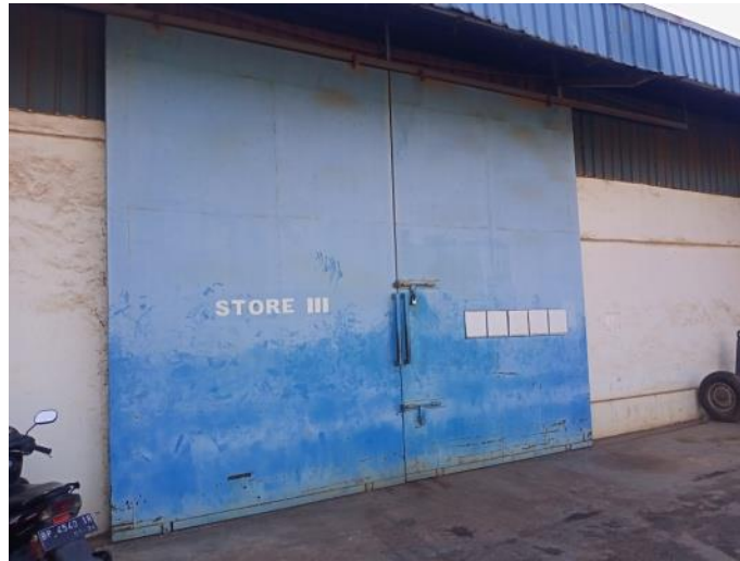
Gambar 1. 12 Store III

Store III adalah tempat untuk menyimpan barang peralatan kapal seperti tali tambat, propeller kapal dan lainnya yang berhubungan dengan peralatan dalam sebuah kapal, dapat kita lihat pada Gambar 1.12 .