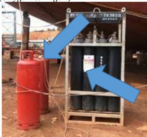
Gambar 1. 27 Tabung Gas