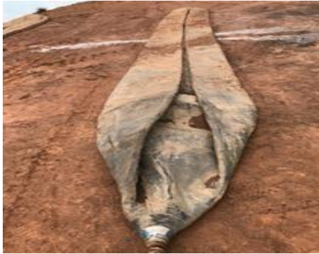
Gambar 1. 13 Air Bags