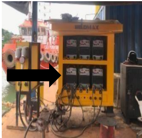
Gambar 1. 23 Welding Machine