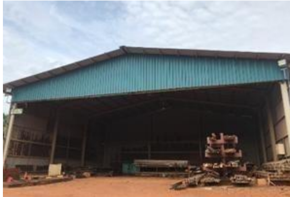
Gambar 1. 7 Workshop Blasting