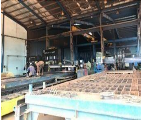
Gambar 1. 17 CNC Machine