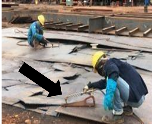
Gambar 1. 22 Brander