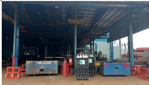
Gambar 1. 6 Workshop cutting, roling dan bending