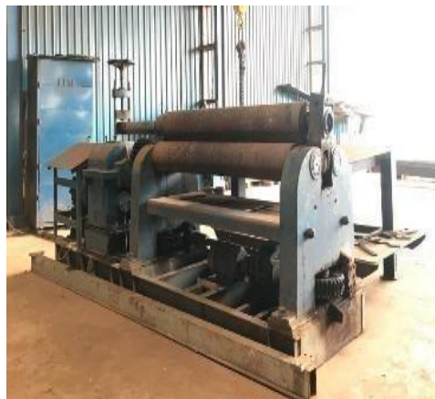
Gambar 1. 20 Rolling Machine