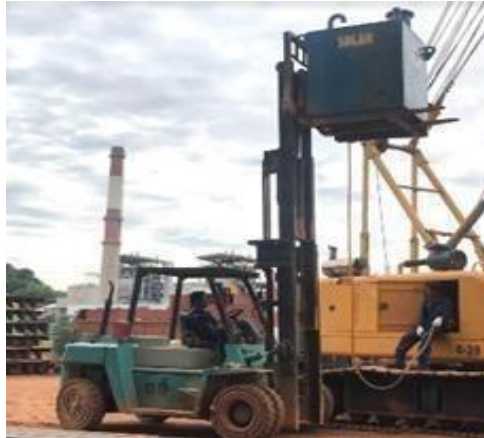
Gambar 1. 16 FrokLift