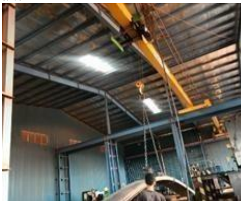
Gambar 1. 21 Over Heat Machine