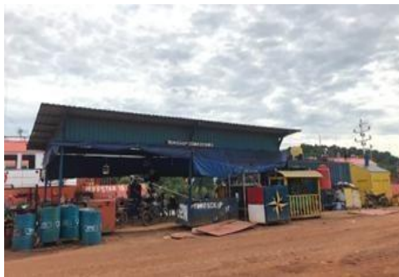
Gambar 1. 9 Workshop Commissioning