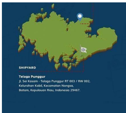
Gambar 1. 1 Peta Lokasi Perusahaan

PT. Bahtera Bahari Shipyard ( BBS )Didirikan pada tahun 2005 di Batam, Perusahaan ini bergerak dibidang New Building Ship, Repair Ship. Alamat Perusahaan berada di Jl. Pattimura - Sei Kasam RT 003 RW 002 Kelurahan Kabil Kecamatan Nongsa, Batam, Kepulauan Riau. PT. Bahtera Bahari Shipyard (BBS) adalah galangan yang melaksanakan pembuatan kapal yang ditunjang dengan sarana pokok berupa lokasi daratan yang cukup luas. Adapun tempat dilaksanakannya pembangunan kapal terdapat pada Galangan jalan Pattimura No.1, Kabil, Nongsa. Secara astronomis terletak pada Lintang Bujur 010 02.758' E 1040 08.277' dan memiliki Luas area ±52 hektar digunakan untuk pembangunan kapal baru, reparasi kapal, dan parkir kapal.