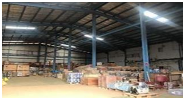
Gambar 1. 5 Store