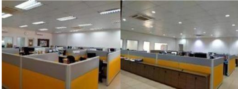
Gambar 1. 4 Main Office