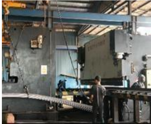
Gambar 1. 19 Shear & Bending Machine