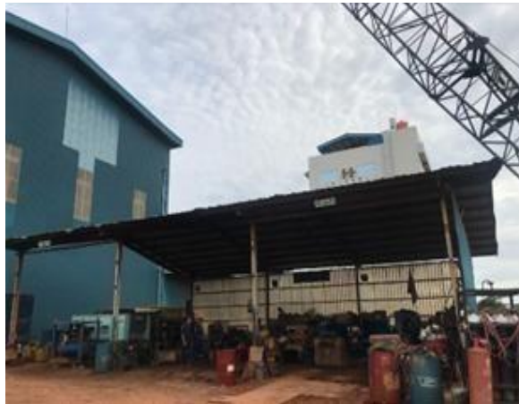
Gambar 1. 11 Workshop Mechanical dan Electric