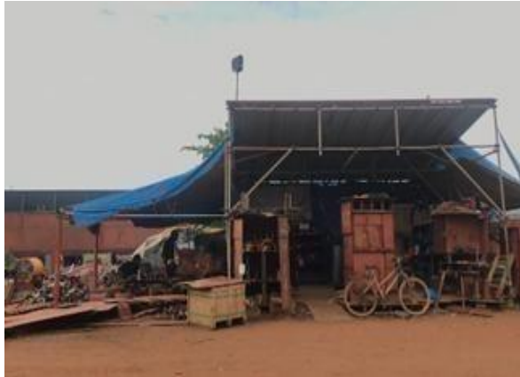
Gambar 1. 10 Workshop Piping