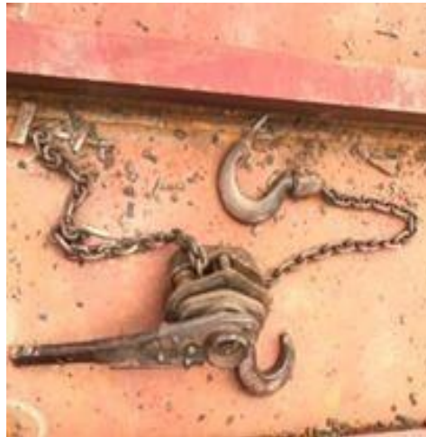
Gambar 1. 26 Level Block