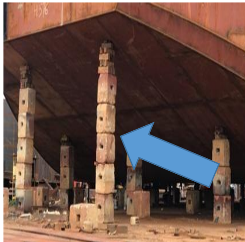
Gambar 1. 29 Stock Block