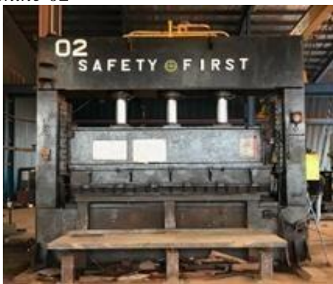
Gambar 1. 18 Banding Machine