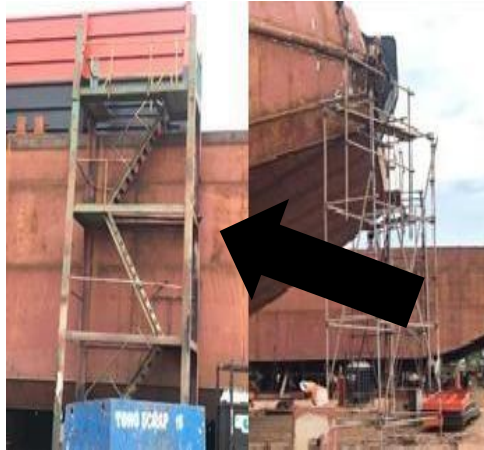
Gambar 1. 28 Ladder