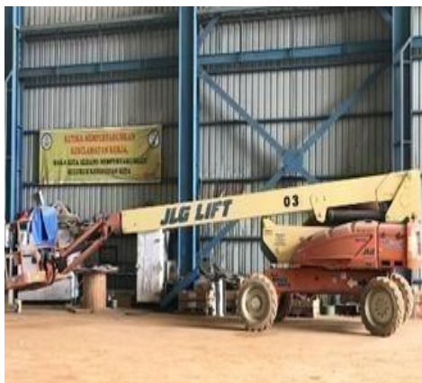
Gambar 1. 15 Manlift