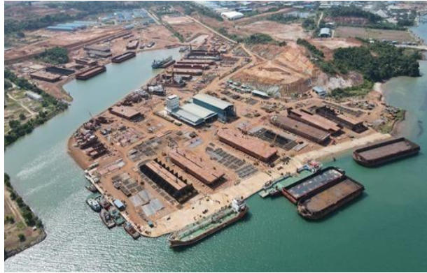
Gambar 1. 3 Galangan PT. Bahtera Bahari Shipyard

Slogan perusahaan “Keselamatan adalah prioritas utama kami” yang dipajang di beberapa sudut inventaris PT. Bahtera Bahari Shipyard menandakan galangan ini mengedepankan aspek keselamatan dalam setiap item pekerjaan. Dalam proses pekerjaan di PT. Bahtera Bahari Shipyard, pihak perusahaan membagi lokasi kerja dalam 2 (dua) bagian, yaitu zona merah dan zona hijau. Zona merah adalah area yang mewajibkan bagi siapapun yang memasukinya menggunakan APD standar (helm, wearpack, safety shoes) dan zona hijau adalah area yang tidak diwajibkan untuk menggunakan APD melainkan hanya menganjurkan. Hal ini ditinjau dari aktivitas pekerjaan yang ada di kedua daerah tersebut.