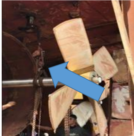
Gambar 1. 25 Chain Block