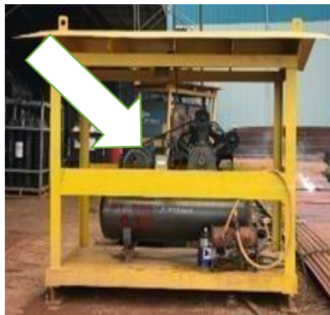
Gambar 1. 24 Compressor Machine