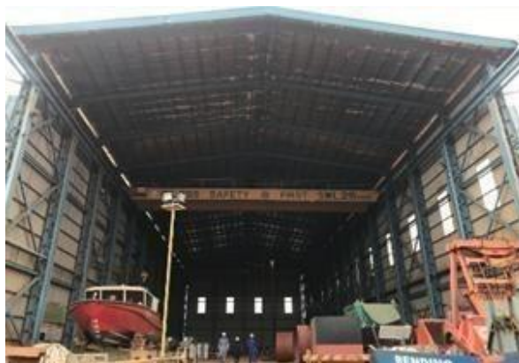
Gambar 1. 8 Workshop Alumunium Boat