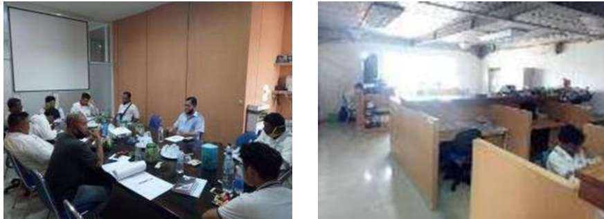
Gambar 1. 3 Ruang PIC

menerangkan ruangan PIC, pada ruangan PIC ini memiliki beberapa sarana kerja berupa. Meja kursi printer laptop dan alat kerjalainnya, pada ruangan PIC ini terdapat juga ruangan Yard Meneger dan kasir.