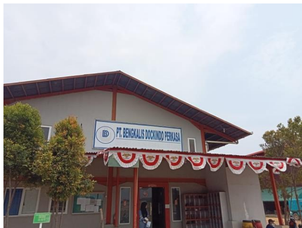
Gambar 1. 1 PT. Bengkalis Dockindo Perkasa

PT. Bengkalis Dockindo Perkasa merupakan salah satu perusahaan yang bergerak dibidang Industri Kapal. Jenis Kegiatan kegiatan PT. Bengkalis Dockindo Perkasa yaitu pemeliharaan dan perbaikan kapal. Galangan kapal yang akan dibangun oleh PT. Bengkalis Dockindo Perkasa adalah sebuah tempat yang dirancang untuk memperbaiki dan membuat Kapal. PT. Bengkalis Dockindo Perkasa memiliki komitmen terhadap lingkungan dan patuh terhadap Peraturan Perundang-undangan yang berlaku dibidang lingkungan. Usaha dan atau kegiatan PT. Bengkalis Dockindo Perkasa bergerak dibidang Industri Galangan Kapal dengan skala < 50.000 DWT. Mengacu pada Peraturan Menteri Negara Lingkungan Hidup Nomor 05 Tahun 2012 tentang jenis Rencana Usaha dan/atau kegiatan yang wajib memiliki Amdal; kegiatan PT. Bengkalis Dockindo Perkasa tidak termasuk dalam kriteria wajib amdal. Selanjutnya berdasarkan peraturan Menteri Negara Lingkungan Hidup Nomor 13 tahun 2010, PT. Bengkalis Dockindo Perkasa wajib memiliki upaya pengelolaan Lingkungan Hidup dan Upaya Pemantauan Lingkungan Hidup yang selanjut nya disebut UKL-UPL. Penyusunan UKL-UPL PT. Bengkalis Dockindo Perkasa mengacu dan berpedoman kepada Peraturan Menteri Negara Lingkungan Hidup Nomor 16 tahun 2012. Berdasarkan UKL-UPL tesebut maka tugas dan tanggung jawab masingmasing pihak akan jelas dalam melakukan upaya penanggulangan dampak lingkungan yang timbul akibat dari pelaksanaan kegiatan PT. Bengkalis DockindoPerkasa.