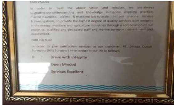
Gambar 1.1 BOS