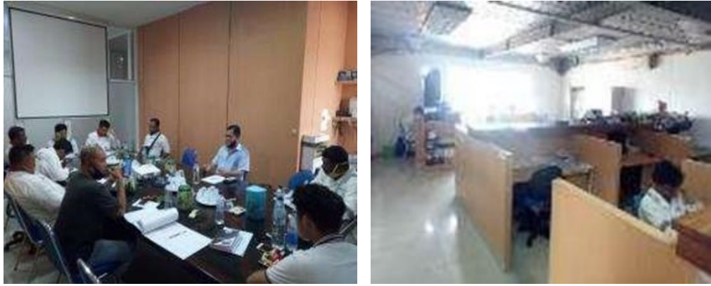
Gambar 1. 2 Ruangan PIC PT. Bengkalis Dockindo Perkasa

Pada gambar 1.2 menerangkan ruangan PIC, pada ruangan PIC ini memiliki beberapa sarana kerja berupa. Meja kursi printer laptop dan alat kerja lainnya, pada ruangan PIC ini terdapat juga ruangan Yard Meneger dan kasir.