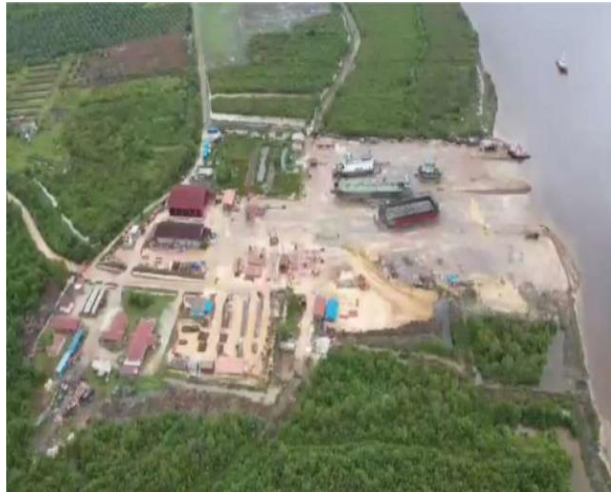
Gambar 1. 1 PT. Bengkalis Dockindo Perkasa

Mewujudkan visi perusahaan melalui peningkatan realisasi komitmen perusahaan menyediakan dan mengoperasikan jasa yang handal dengan mutu kelas dunia.