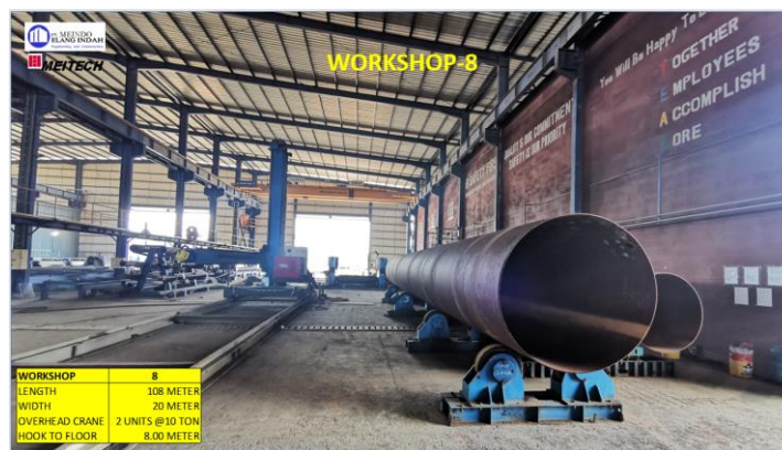
Gambar 1.6 Workshop 8