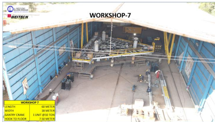
Gambar 1.5 Workshop 7