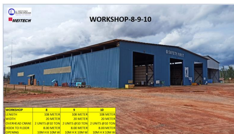
Gambar 1.7 Workshop 8-9-10