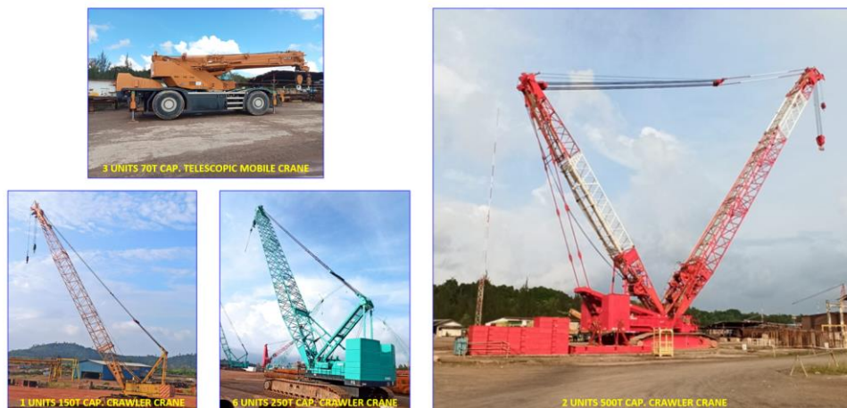
Gambar 1.2 Crane Milik PT.MEB