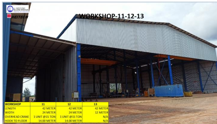
Gambar 1.8 Workshop 11-12-13