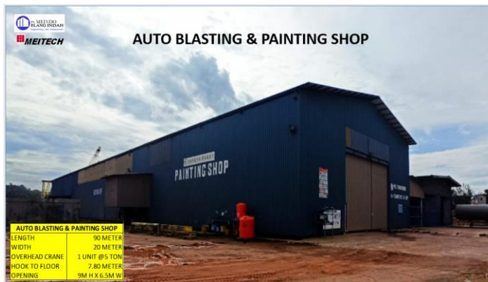
Gambar 1.9 Workshop Auto Blasting dan Painting Shop