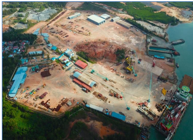
Gambar 1.1 Area di PT.MEB

PT.Meitech Eka Bintang didirikan pada tahun 2015, dengan halaman fabrikasi 49 hektar untuk menangani fabrikasi topside , jacket dan modul , serta instalasi pipa darat/lepas pantai di Indonesia. PT Meitech Eka Bintang merupakan anak dari perusahaan PT Meindo Elang Indah yaitu salah satu kontraktor EPCI terkemuka di Indonesia yang menyediakan solusi terintegrasi penuh dalam layanan rekayasa, pengadaan, konstruksi dan instalasi untuk industri petrokimia, energi dan industri hulu minyak dan gas.