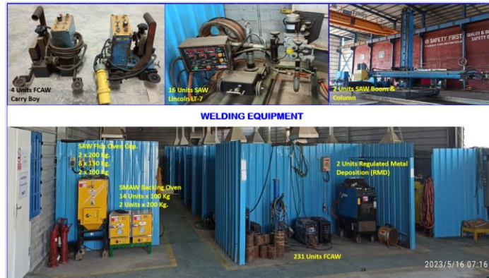
Gambar 1.3 Welding Equipment Milik PT.MEB