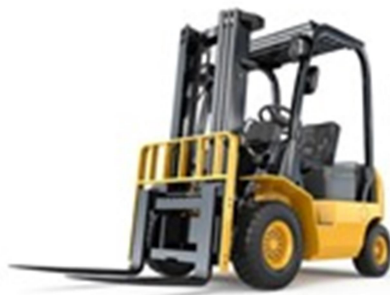
Gambar 1.5 Forklift

Forklift merupakan truk yang digunakan untuk mengangkat dan memindahkan material namun terbatas dalam jarak pendek dan ketinggian angkat tertentu.