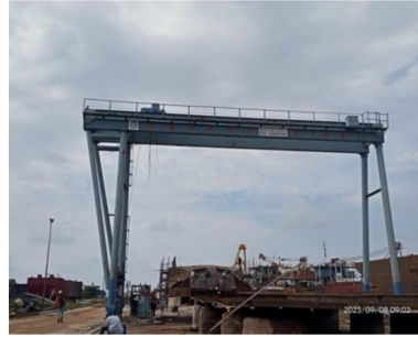
Gambar 1.6 Gantry Crane