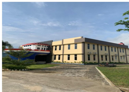
Gambar 1.3 Office

Office di PT. Karimun Marine Shipyard terdapat ruangan resepsionis, ruang meeting, ruang manager, ruang engineering, dan ruangan ganti untuk class yang datang dan dilengkapi dengan fasilitas pendukung lain nya. Sekarang sedang dalam pembangunan office yang baru.