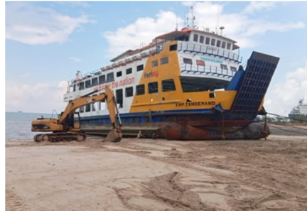
Gambar 1.2 Slip Way

Fasilitas slip way yang di gunakan di sini adalah ballon, dimana ballon ini di gunakan untuk proses penaikan dan penurunan kapal dan untuk spesifikasi ballon untuk materialnya natural rubber dengan diameter 0.6-2.8 m dan panjang 5-24 m. adapun gambar slip way bisa dilihat pada gambar 1.2