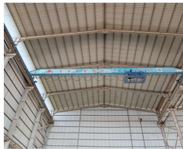
Gambar 1.7 Overhead Crane

Overhead Crane merupakan hoist crane yang terpasang dibagian atas atap bangunan untuk mengangkat dan memindahkan beban. Adapun gambar Overhead Crane dapat di lihat pada Gambar 1.7