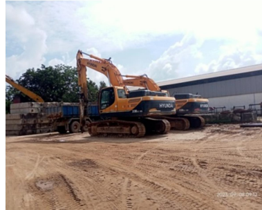
Gambar 1.9 Excavator

Excavator merupakan alat berat dengan rangkaian lengan atau batang/arm, tongkat atau bahu, bucket atau keranjang yang berfungsi sebagai alat keruk, serta tenaga penggerak hidrolis. Adapun gambar Excavator dapat di lihat pada Gambar 1.9