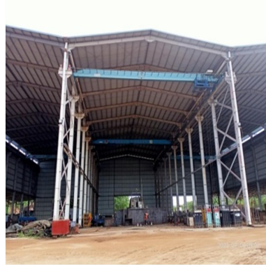
Gambar 1.4 Main Workshop Fabrication