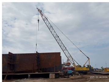
Gambar 1.8 Crawler Crane

Crawler Crane merupakan alat angkat yang dapat berpindah dan memiliki keunggulan bekerja di permukaan yang lunak. Adapun gambar Crawler Crane dapat di lihat pada Gambar 1.8