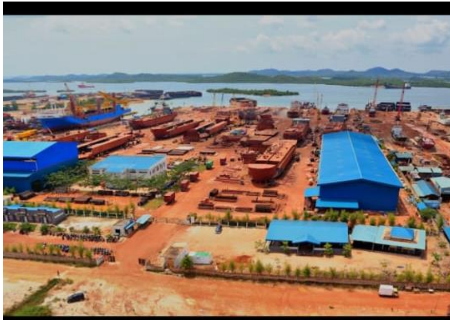
Gambar 1.1 PT. Usda Seroja Jaya

Perusahaan pelayaran PT. Usda Seroja Jaya merupakan salah satu perusahaan swasta yang didirikan pada tanggal 1985. Perusahaan ini memiliki pengalaman yang cukup lama dan memiliki tenaga ahli yang cukup tinggi dalam membangun kapal kapal baru, melakukan proses docking kapal, mengoprasikan kapal yang mengangkut muatan berbagai jenis hampir di seluruh wilayah Indonesia, dan memberikan layanan keagenan kapal yang handal dan cepat di beberapa wilayah Indonesia.