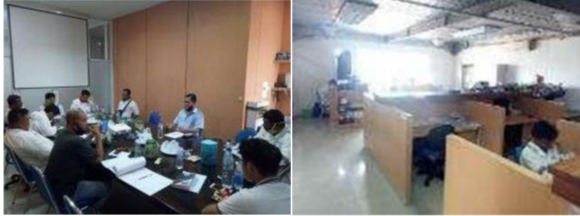
Gambar1 21 Ruang PIC