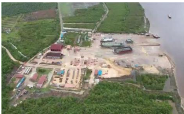
Gambar1 IPT Bengkalis Dockindo Perkasa

Mewujudkan visi perusahaan melalui peningkatan realisasi komitmen perusahaan menyediakan dan mengoperasikan jasa yang handal dengan mutu kelas dunia.