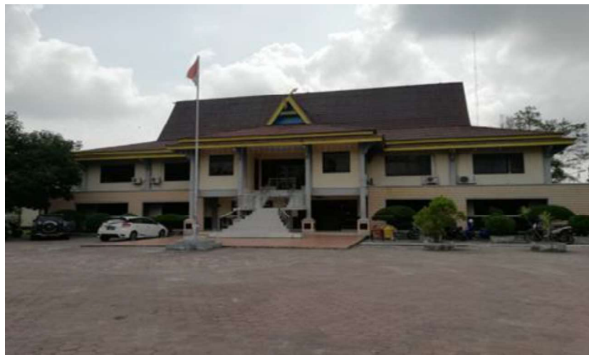
Gambar I.1 Kantor Dinas PUPR Kota Dumai

Dinas Pekerjaan Umum dan Penataan Ruang (PUPR) Kota Dumai merupakan kantor Dinas yang bertugas sebagai penyelenggaraan urusan pemerintah bidang pekerjaan umum, pembangunan infrastruktur dan perumahan untuk daerah Dumai. Dinas PUPR berada di Jl. Brigjen HR. Soebrantas, Kelurahan Teluk Binjai, Kecamatan Dumai Timur, Kota Dumai, provinsi Riau. Menurut Peraturan Walikota Nomor 50 Tahun 2016 tentang Uraian Tugas Dinas PUPR, Dinas PUPR mempunyai tugas dan fungsi untuk membantu Walikota melaksanakan urusan pemerintahan yang menjadi kewenangan Kota dan tugas pembantuan dibidang Pekerjaan Umum dan Penataan Ruang.